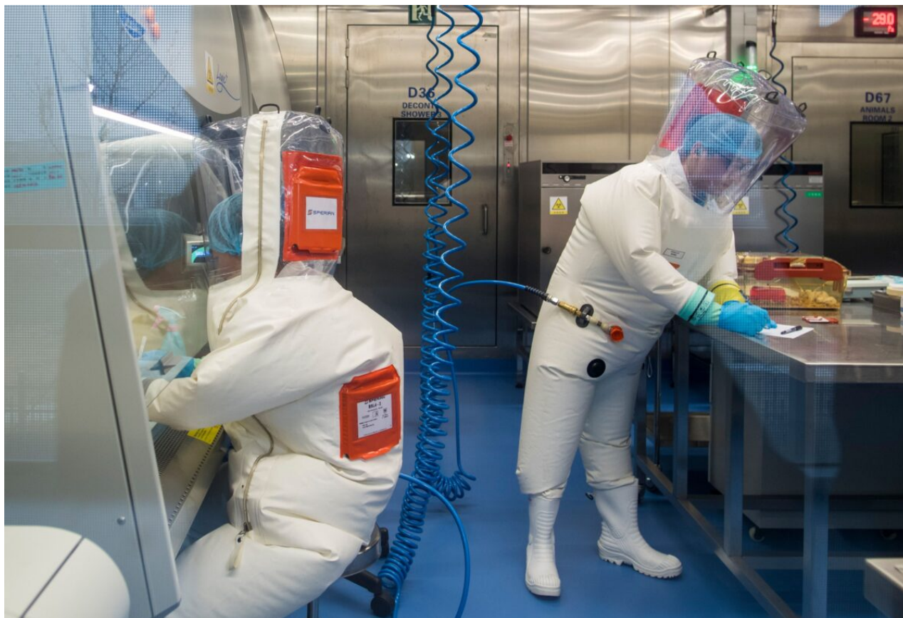
Pracovníci jsou vidět vedle klece s myši uvnitř laboratoře ve Wu-chanu, 23. února 2017.

„Moje odpověď zněla: ‚Pokud je toto základem vaší analýzy, pak nemáte pro svou analýzu žádný základ‘. V podstatě fungovali způsobem, který byl naprosto neslučitelný s transparentností, pravdou a jakoukoli odpovědností,“ komentuje Asher.