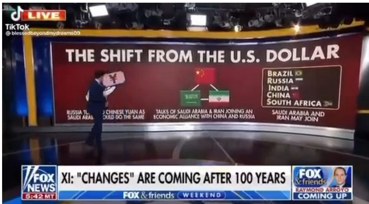
Posun od amerického dolaru jako téma na TV Fox News

Tento zázračný instrument vedl k tomu, že Američané měli v obchodech vždy levné zboží, dokonce bez DPH (VAT) v drtivé většině států americké unie, měli levné jídlo, levné oblečení, levnou elektroniku, levná auta, levné energie, levná paliva. A to právě kvůli petrodolaru, který se stal rezervní měnou díky tomu, že byl opřený o arabskou ropu, kterou nebylo možné koupit za jinou měnu než dolar.