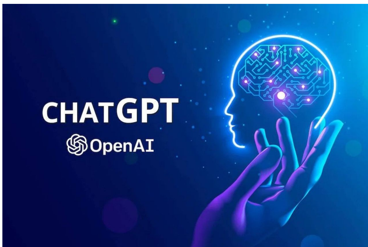
ChatGPT AI od firmy OpenAI

Nejpokročilejší umělou inteligencí je podle všeho neurální analytický stroj se skalárním učením, který pracuje jako generativní předtréninkový transformátor chatu (zkráceně ChatGPT) a umí odpovídat na základě načerpaných tréninkových textů, což jsou miliardy novinových článků, knih a časopisů od počátku 20. století až do konce roku 2021.