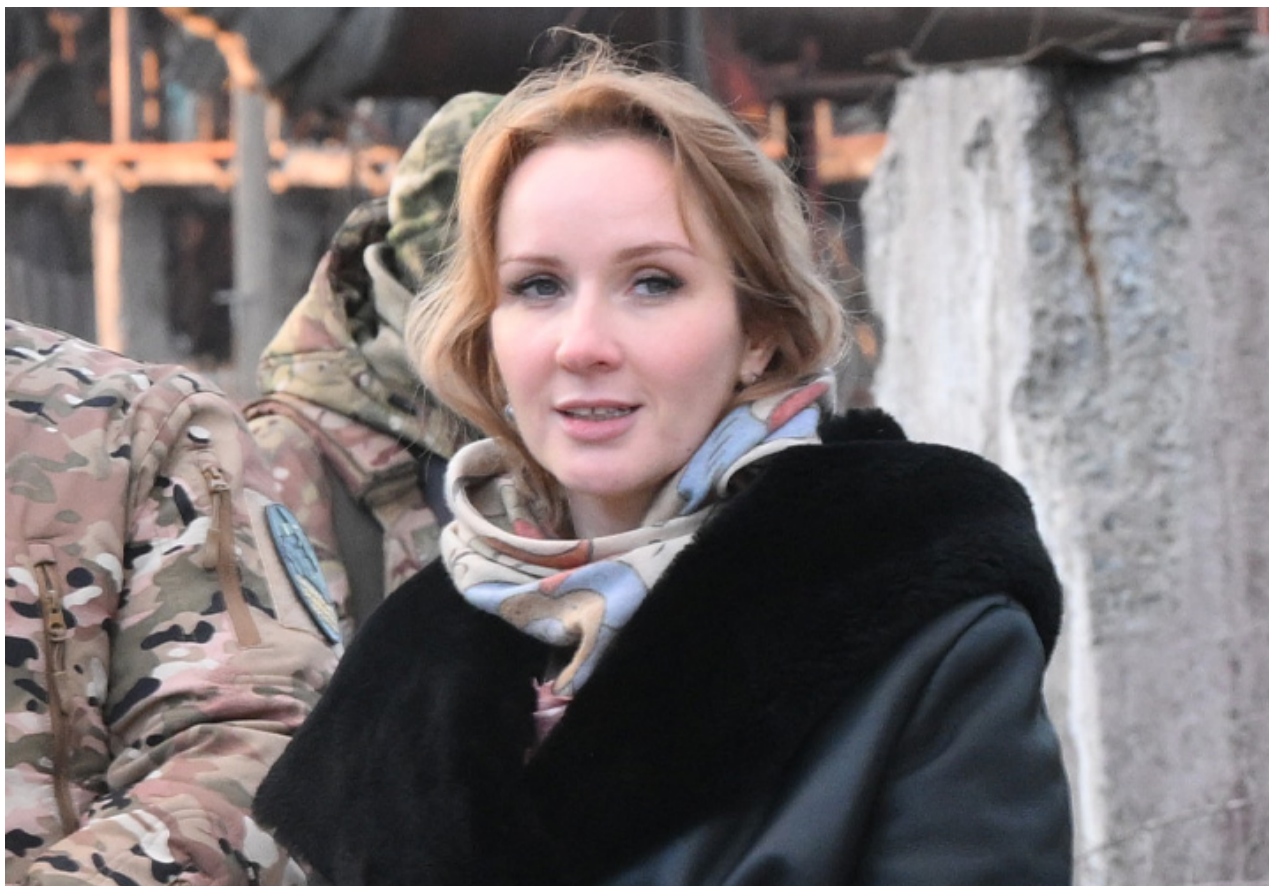
Maria Lvova-Belova.

A začalo to být děsivé. Protože nevíte, jak na to. Protože neexistuje žádný mechanismus. Protože je to jiná země . A protože děti, které k nám přicházely, nejsou vcelku naše. A my teď musíme zajistit, aby dostávaly skutečné rodiny.