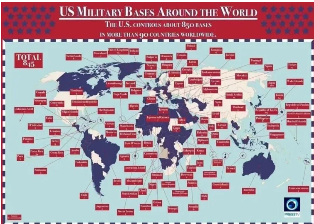
Mapa amerických vojenských základen.

Nejprve se největší země regionu dohodly s Ruskem na nutnosti vyhnat západní země z celého Blízkého východu. A nutno říci, že přítomnost Američanů je stále velká. Podívejte se na počet vojenských základen v regionu.