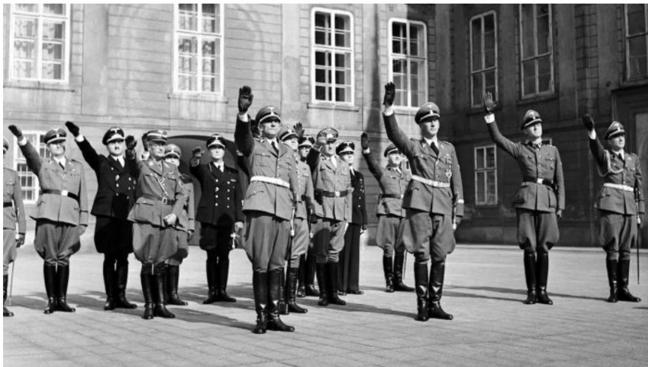
Reinhard Heydrich (3. zprava) na Pražském hradě

O této historické epizodě se mezi českými historiky hovoří jako o době temna v českých dějinách, protože celý národ se vrhl do zbrojní výroby na podporu III. Říše. Obrovský český průmysl začal chrlit děla, tanky, stíhačky, munici, zbraně, prostě úplně všechno pro Wehrmacht a rovněž jednotky SS. Atentát na Reinharda Heydricha na jaře roku 1942 přišel na pokyn z Londýna jako pokus o zoufalé zatažení za záchrannou brzdu, aby Češi nebyli na konci války vykresleni jako ti, kteří stáli na straně poražené Osy.