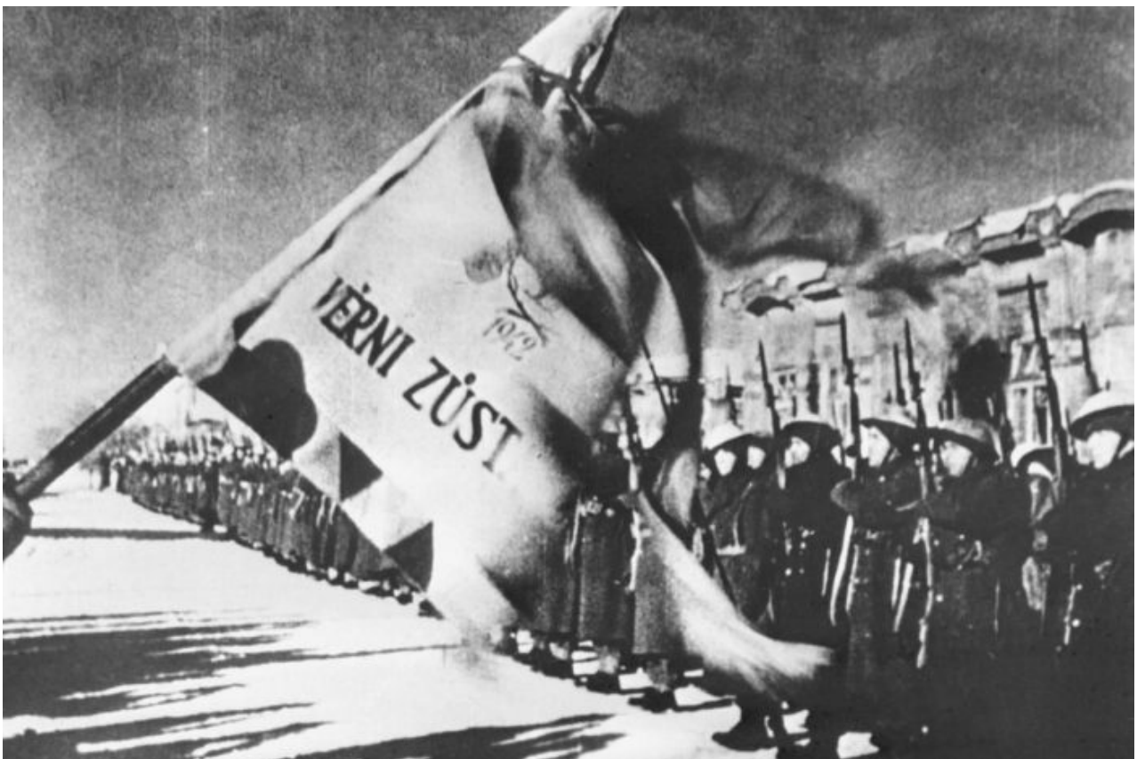
Fotka z Buzuluku zachycuje nástup vůbec prvních vojáků budoucího 1. ČS Armádního sboru