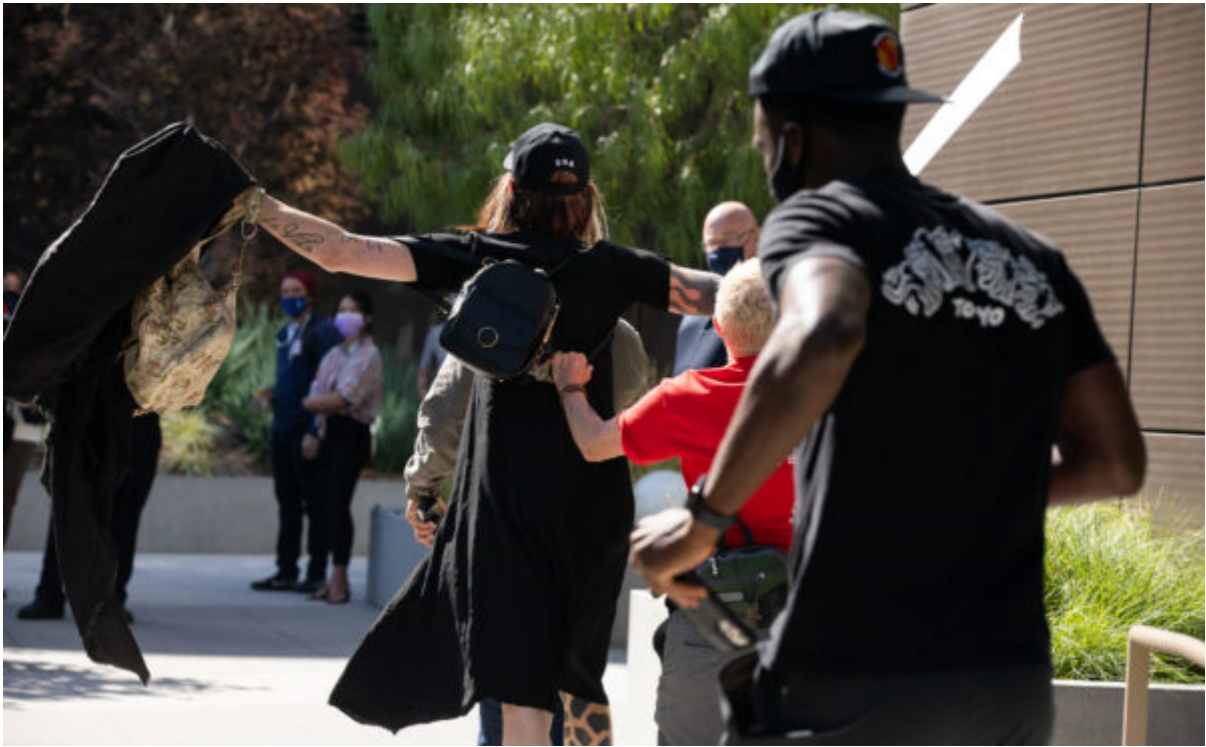
Transgenderový člen Antify napadá homosexuálního aktivistu s nápisy o svobodě projevu v Los Angeles, 10. října 2021.

„Je to stejně vážné, jako když se rozpadne velmi vážný vztah. Ale člověk se přes to dostane, stejně jako zlomené srdce se to časem spraví.“