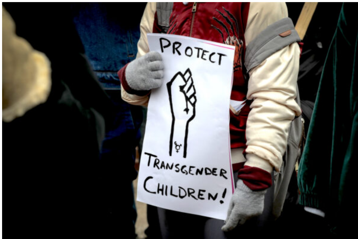
Protestující zastávce trans ideologie v Chicagu, 25. února 2017.

Pro některé to může znamenat zpochybnění svého pohlaví, ale „velká většina mladých lidí, kteří tvrdí, že se ve svém těle necítí dobře, od tohoto tvrzení upustí, jakmile projdou dospíváním“, poznamenává akademik.