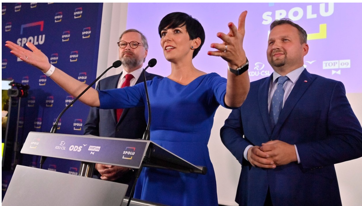
Petr Fiala, Markéta Pekarová Adamová, Marian Jurečka