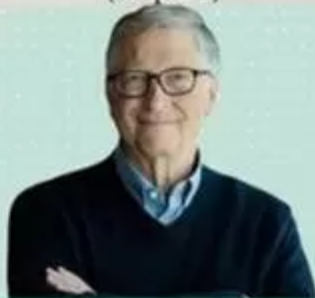
Bill Gates (“Expert”)

“Everyone who takes the vaccine is reducing their transmission.”