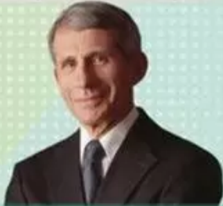
Dr. Anthony Fauci (NIAID Director)

“When people are vaccinated they're not going to get infected.”