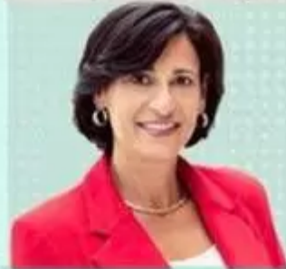
Rochelle Walensky, MD (CDC Director)

“Vaccinated people do not carry the virus and don't get sick.”