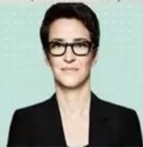
Rachel Maddow (MSNBC News)

“Now we know the vaccines work well enough that the virus stops.”