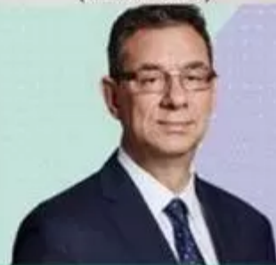
Albert Bourla (Pfizer CEO)

“There is no variant that escapes the protection of our vaccines.”