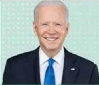
President Joe Biden (POTUS)

“You're not going to get COVID if you have these vaccinations.”