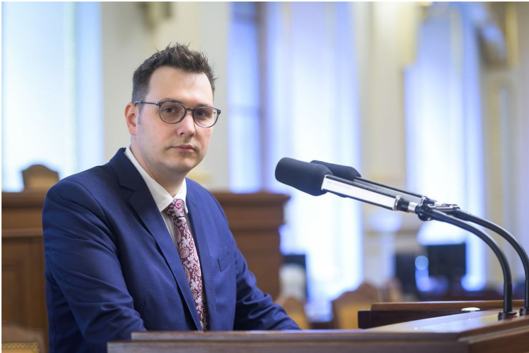
Jan Lipavský (Piráti), ministr zahraničí ČR

Útok na Patriarchu Kirilla je přitom projevem zbabělosti českého ministra zahraničí, protože Patriarcha samozřejmě se nebude bránit, ani nezvedne telefon a nebude volat rezidentuře SVR v Praze, aby zahájila ministra v odvetě za tento ubohý útok. Lipavský je naprostá politická nula, nachází se pod rozlišovací schopností Patriarchy, o tom není potřeba se dohadovat.