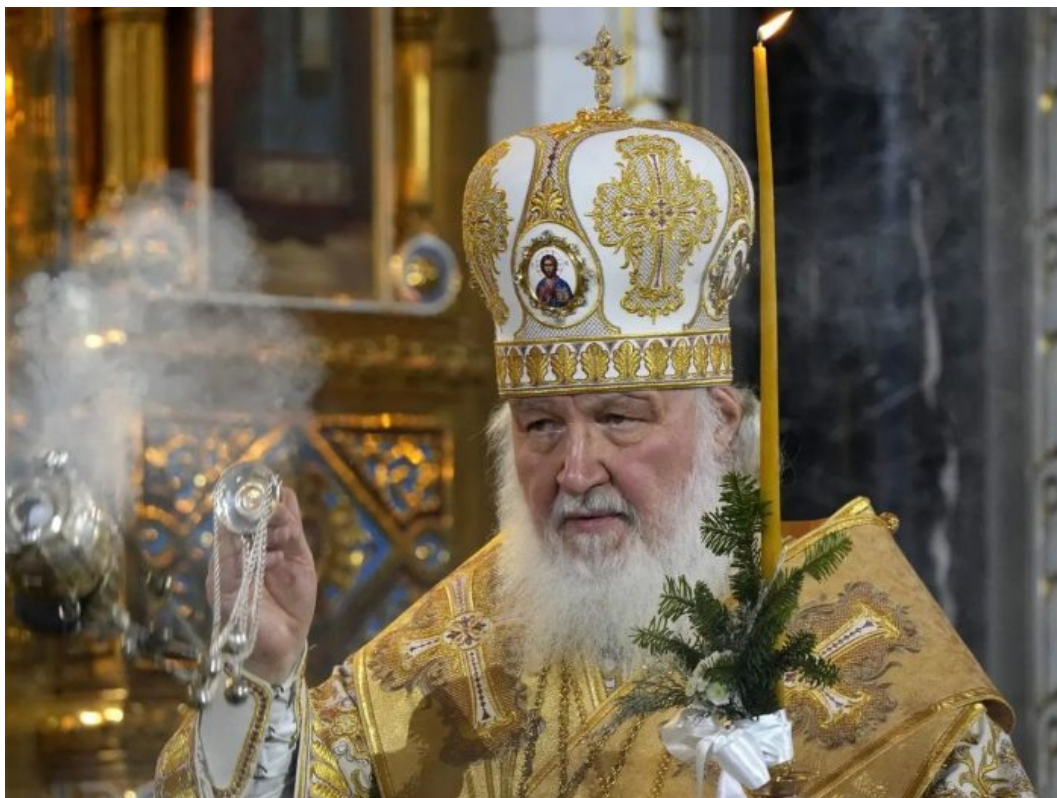
Moskevský Patriarcha Kirill

Lipavského útok na hlavu ruské pravoslavné církve jde doslova ve stopách právě probíhajícího a organizovaného pogromu na Ukrajině proti Ukrajinské pravoslavné církvi, ve které Zelenského režim spatřuje prodlouženou ruku moskevského Patriarchy Kirilla, který si dovolil požehnat ruským vojákům, kteří byli povoláni na frontu.