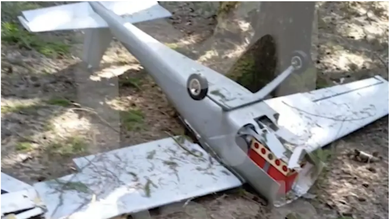
Letoun UJ-22 ukrajinské armády v lese u Moskvy.

„Minulý týden naši zpravodajští důstojníci obdrželi informaci o Putinově cestě do průmyslového parku v Rudnevu. V souladu s tím náš kamikadze dron, který proletěl všemi systémy protivzdušné obrany Ruské federace, vzletl a havaroval poblíž průmyslového parku.