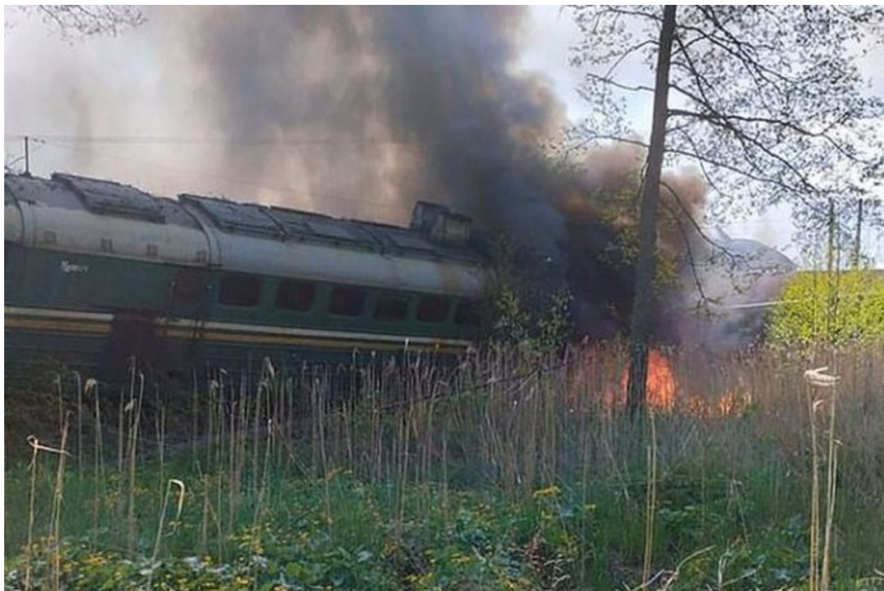
Vykolejený běloruský vlak v Brjanské oblasti

Hlavním cílem Západu je destabilizace Putinova režimu a jalové výsledky ukrajinské armády dokazují, že na frontě na Ukrajině prostě Rusko porazit a poškodit nejde. A selhaly i ekonomické sankce proti Rusku. Ani ty neuspěly. Jediným řešením je tak partyzánská činnost a přenesení války přímo dovnitř Ruska, a to formou sabotáží a zřejmě i formou státem a západem sponzorovaného terorismu uvnitř Ruska.