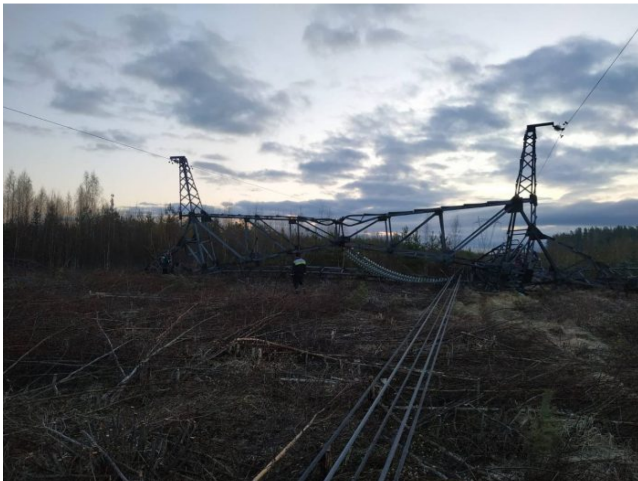
Následky sabotáže na sloupy VVN v Leningradské oblasti

Podle ruských bezpečnostních složek se chystá Kyjev na nejhorší, tedy na situaci, že ofenzíva proti Rusům žádný výsledek nepřinese a bude hrozit konec západní podpory. Pro takový případ má Kyjev v záloze tzv. Plán B, který spočívá v tom, že Ukrajina zcela rezignuje na jakékoliv další ofenzívy a namísto toho přistoupí k vedení partyzánské války proti Rusku s cílem vyvolat v Rusku strach a nedovolit znovuzvolení ruského prezidenta Vladimira Putina příští rok v březnu. Kyjev zatím provádí sabotáže jen v malém rozsahu a omezuje je na ruské příhraničí a na Krym. Útok na vedení VVN až v Leningradské oblasti ale naznačuje, že toto příhraniční omezení pro sabotáže právě padlo.