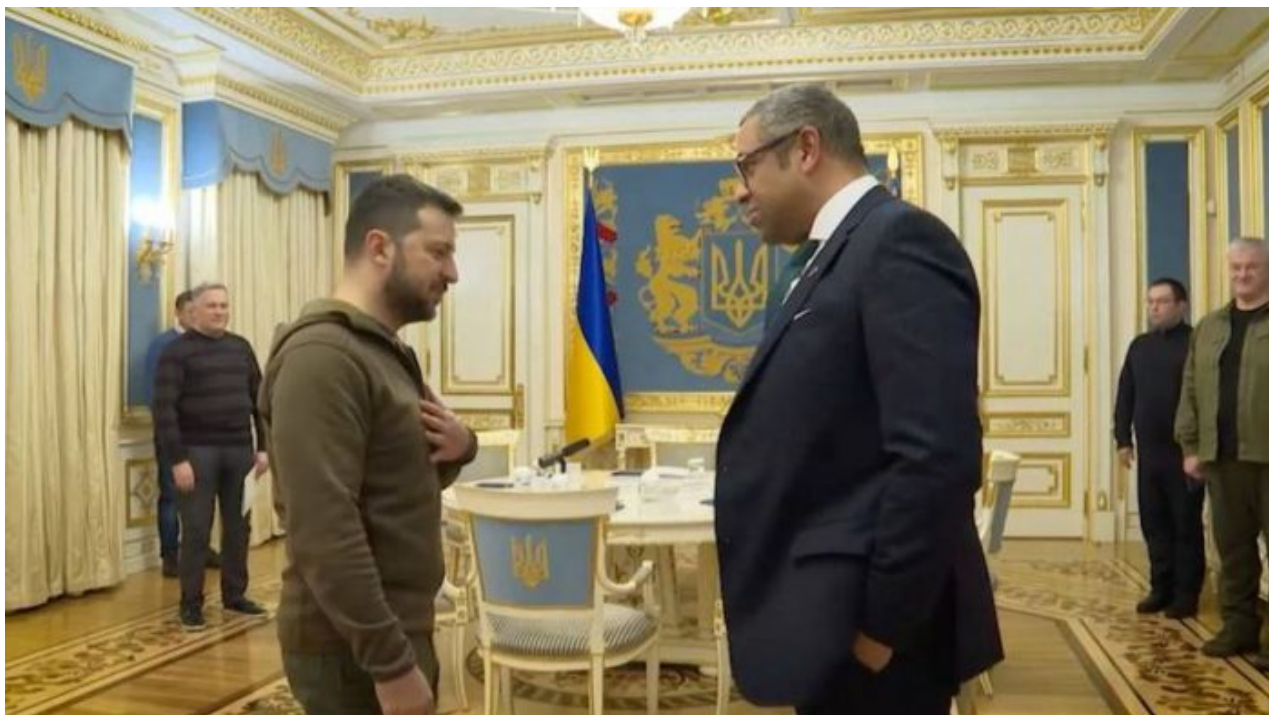
Volodymyr Zelenskyy a James Cleverly, britský ministr zahraničí při inspekční cestě v Kyjevě

Bylo by hodně bizarní, kdyby židovský prezident Zelenskyy nachystal Ukrajině právě tento osud Palestiny. Namísto míru nekonečná válka a terorismus uvnitř Ruska jako cesta k zániku Ukrajiny podobně, jaká potkala Palestince po více jak 70 letech jejich partyzánského boje uvnitř Izraele. Jenže ti Palestinci na ten boj stejně tak dlouho čerpají peníze od mnoha zemí, v posledních dekádách hlavně od EU. Kruh se uzavírá. Jak je tedy vidět, Ukrajinu podle plánu B čeká osud Palestiny. Peníze pro vůdce a předáky Ukrajiny budou, i když Ukrajina postupně už nebude. Pokud dojde na varování Sergeje Naryškina, že ukrajinským plánem B je právě partyzánská a sabotážní činnost uvnitř Ruska, potom se bude jednat o zopakování palestinského scénáře po roce 1948.