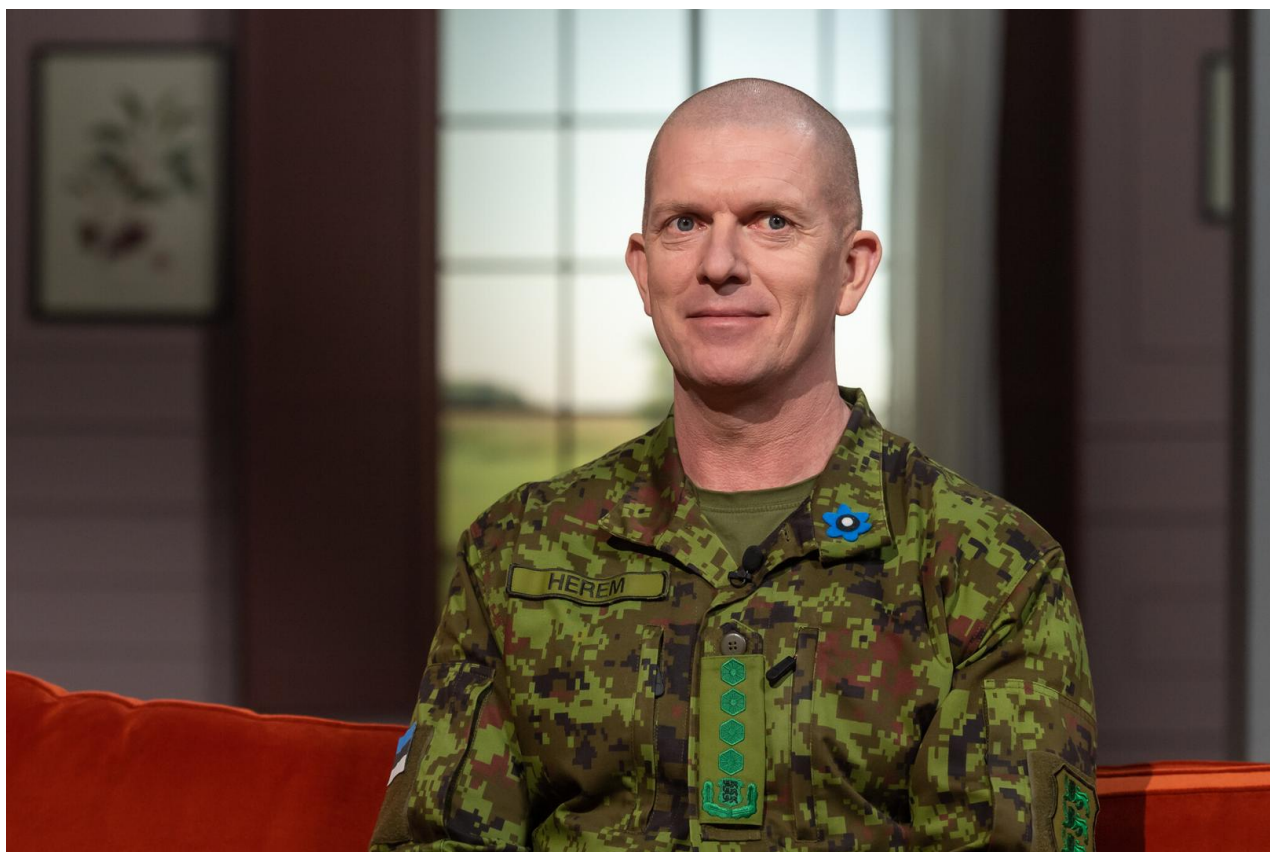
Martin Herem.

Podle oznámení nejvyššího estonského generála Marina Herema má mít Estonsko brzy k boji s Rusy připraveno a vycvičeno i s povolanými záložníky 43 700 po zuby nejmoderněji vyzbrojených vojáků! Estonsko má 1.3 miliony obyvatel. Srovnatelně podle počtu obyvatel by AČR měla připravit k boji s Ruskem 352 800 vojáků. AČR má zatím jen 32 000 vojáků i se všemi svými rezervisty. Avšak nějakou náhodou začal zrovna 14 dní před vyhlášením generála Harema o zvyšování počtů estonské armády nejvyšší český generál Řehka nacvičovat odvozy do české armády! Prý máme být v klidu, vzkazoval Řehka, že o mobilizaci nejde!