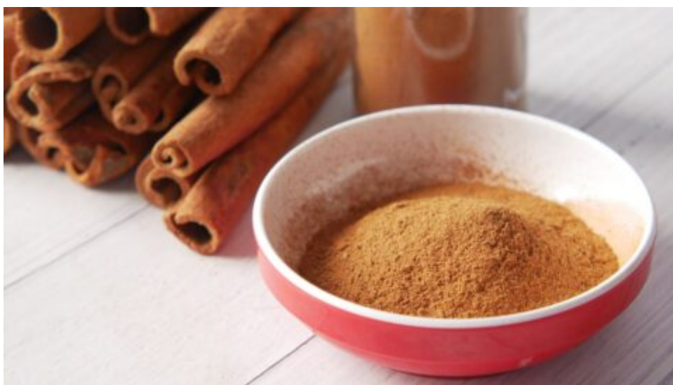
Zázrak jménem skořice zlepšuje paměť a schopnost učení