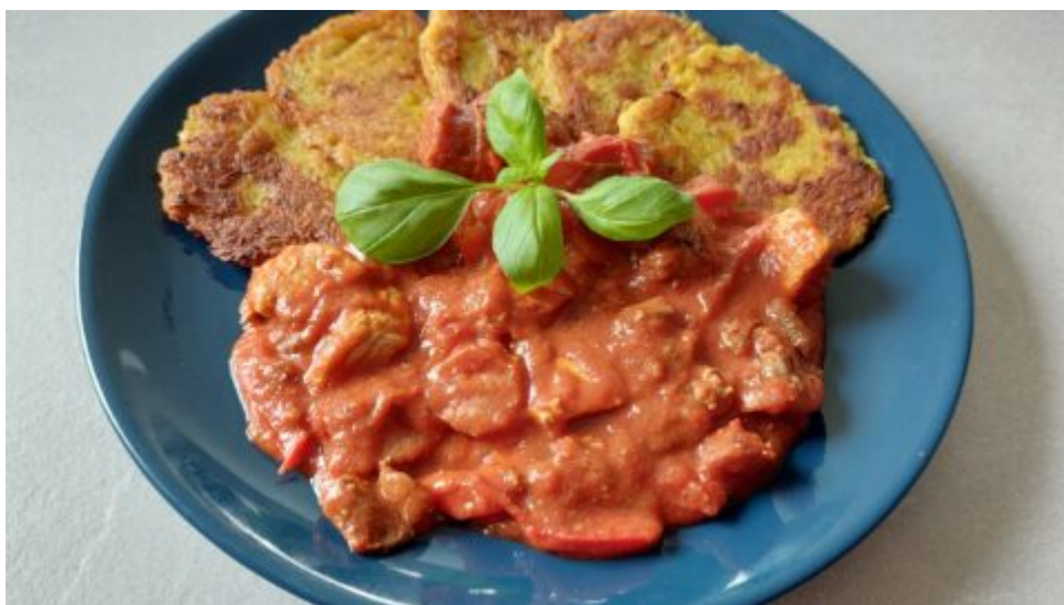
Drůbeží masová směs s klobáskou a bramboráky