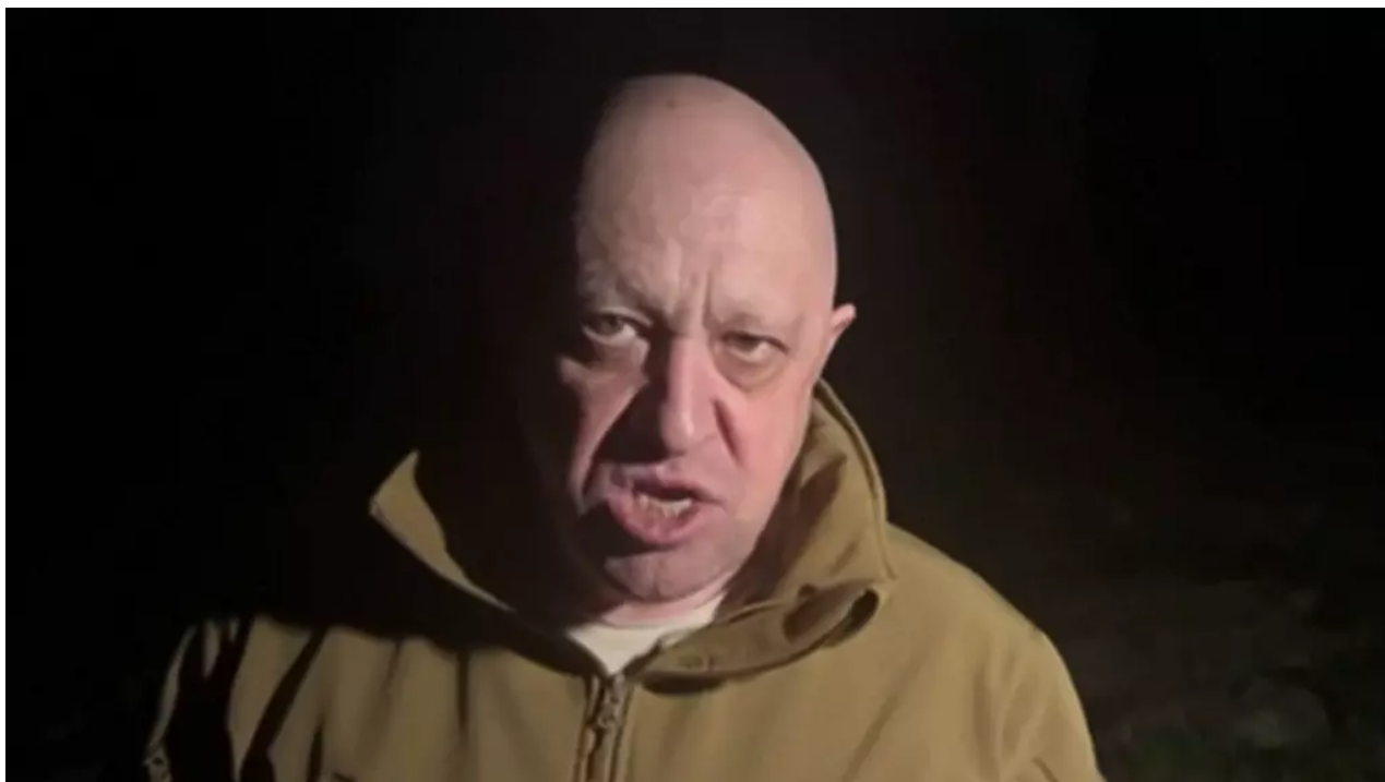
Jevgenij Prigožin

„Dědeček, naprostý ...“ Prigožin se poprvé pustil přímo do Putina