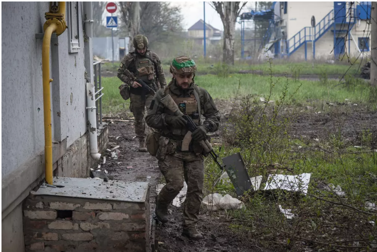
Ukrajínští vojáci v Bachmutu

a severozápadně od Bile Hory, která leží asi 14 kilometrů jihozápadně od města. Vyplývá to ze záběrů, jež se podařilo zeměpisně určit.