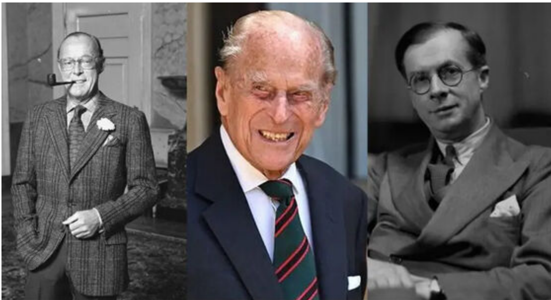
Three useless eaters fond of projection: Prince Bernhard, Prince Philip and Sir Julian Huxley

V rozhovoru pro Deutsche Press Agentur v srpnu 1988 princ Philip prohlásil, že se chce v příštím životě vrátit jako smrtící virus, aby pomohl „vyřešit přelidnění“.