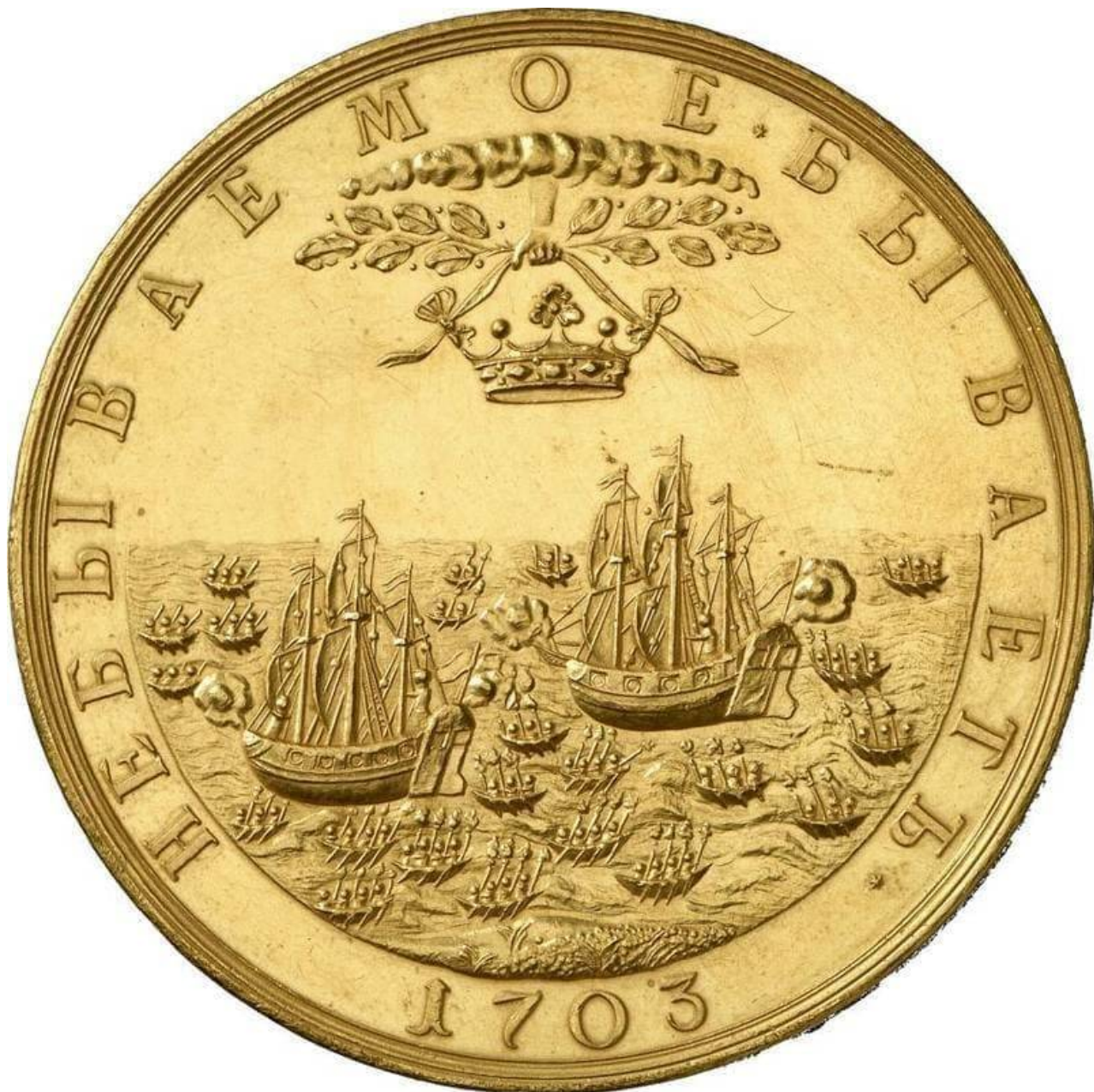
Medaile Za zjetí dvou švédských lodí, 6. května 1703