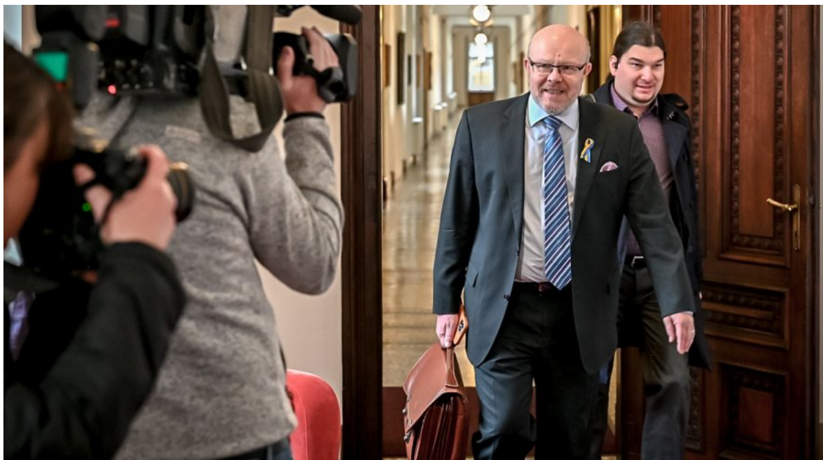
Vicepremiér a ministr zdravotnictví Vlastimil Válek, 17. března 2022.