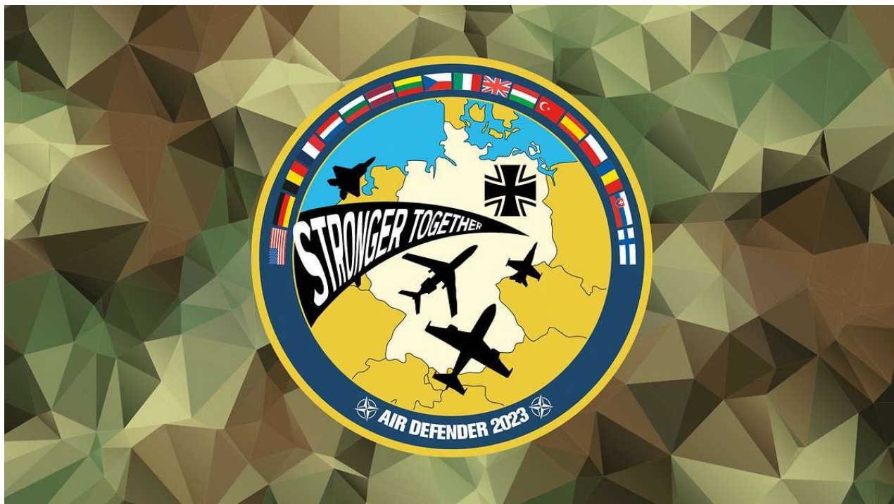
Logo cvičenia (hore) a grafika „cvičebnej plochy“ (dole) sú screenshotsy z webovej stránky Bundeswehru