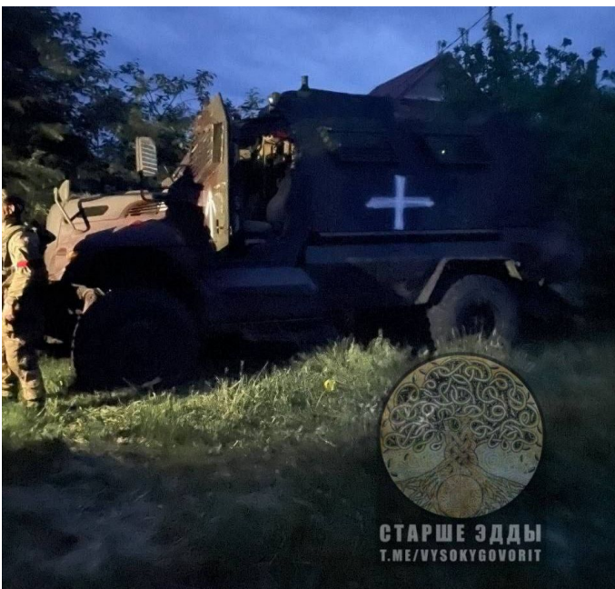
Ruská armáda ukořistila bojové vozidlo MaxxPro, které na místě zanechali diverzanti AFU a bojovníci RDK