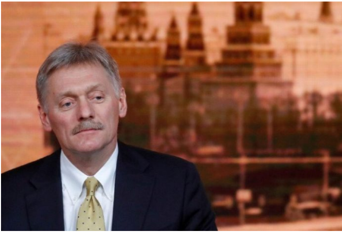
Dmitrij Peskov, mluvčí Kremlu