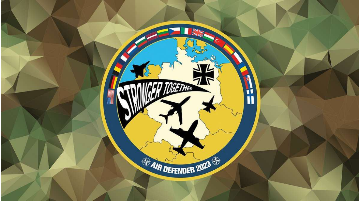
Logo cvičení (nahore) a grafika „cvičiště“ (dole) jsou snímky z webu Bundeswehru

letecké cvičení NATO: „Air Defender“. Tento manévr se stovkami letadel a stíhaček už vzbujuje mezi leteckými společnostmi obavy. Protože budou rozsáhlé zákazy letů. Podle zasvěcených jsou aerolinky ve skutečné poplachové náladě.