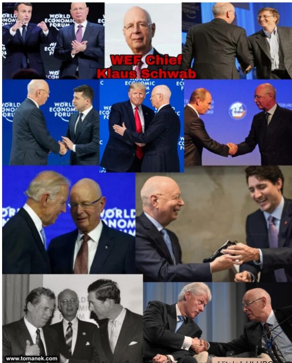
www.tomanek.com WEF = je to pro dočasnou dobu na světě, natož že se tak neuvěřitelně HLUBOKA a