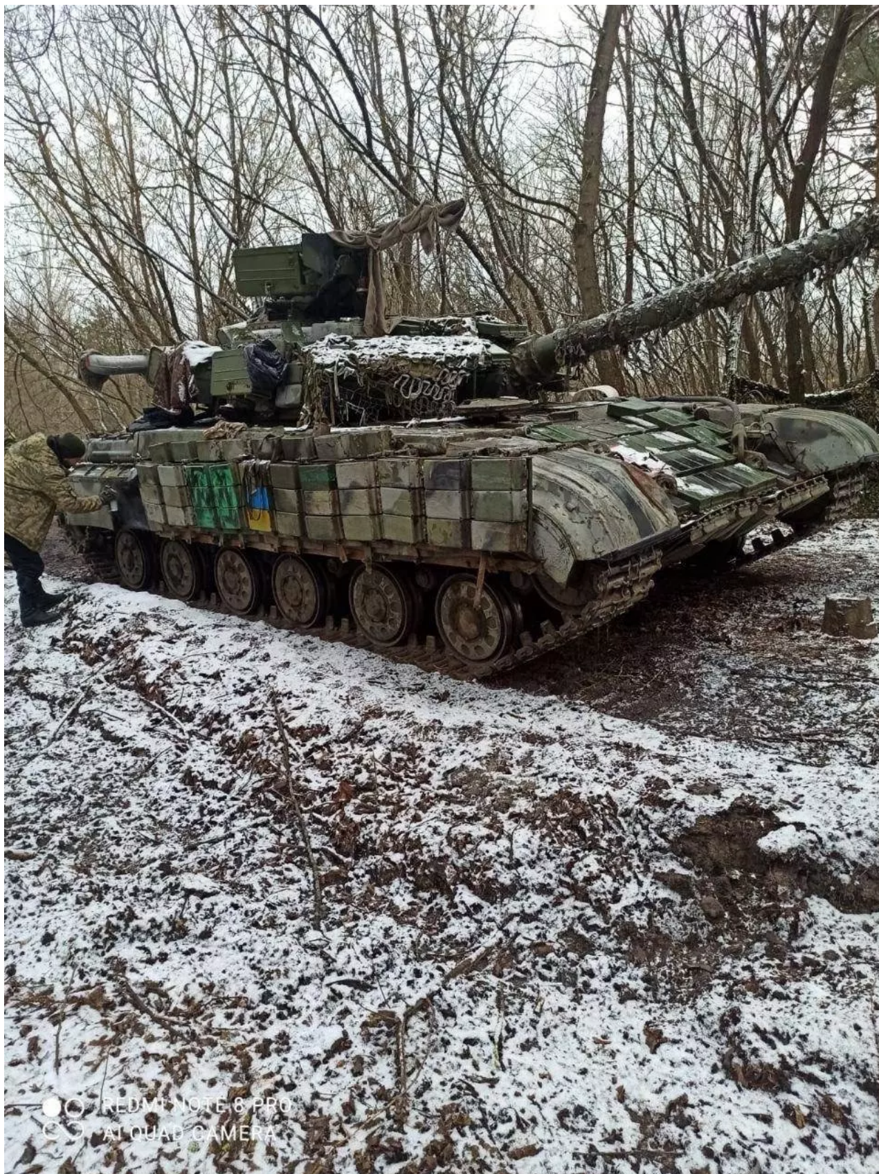
Zamalování kříže na ukrajinském tanku