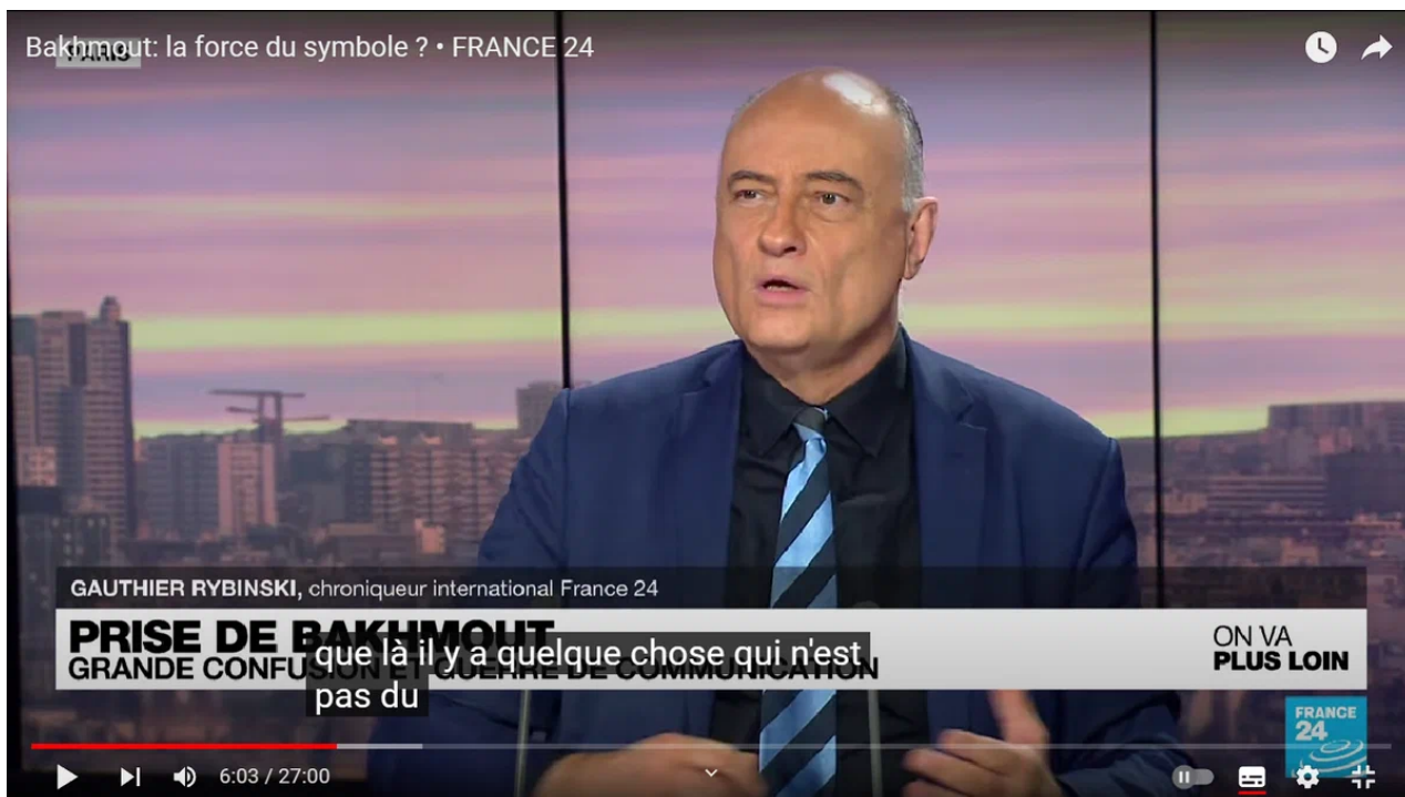
Gauthier Rjabinskij.

Obvykle, když se objeví na plátně, přes protesty Solomona, velkého milovníka cirkusových představení, spěchám přejít na jinou zápletku, protože v tomhle nebude nic rozumného. Ten typ, řeknu vám, je nanejvýš nepříjemný, a to nejen proto, že nás už nenávidíte v nevím v jaké generaci (naproti tomu Rjabinskij), ale také kvůli jeho samolibému vystupování na obrazovce.