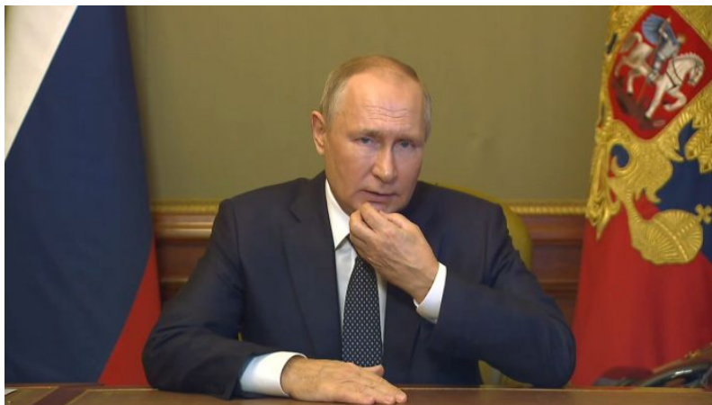
Vladimir Putin, prezident RF

A podle posledních zpráv se v Charkovské oblasti konečně objevily první známky té slavné invaze, protože AFU tam prý soustředí techniku ve velkých počtech. S vysokou pravděpodobností ji použijí na nejslabší místo Rusů, a to je právě Belgorodská a Brjanská oblast, kde není prakticky žádné opevnění Ruské armády, žádné obranné linie, žádné zákopy, žádné linie Ruské armády. Moskva tam teď horečně stahuje vojáky z Novosibirsku a z útvarů za Uralem, narychlo a bez bojového výcviku, protože všechno je to narychlo.