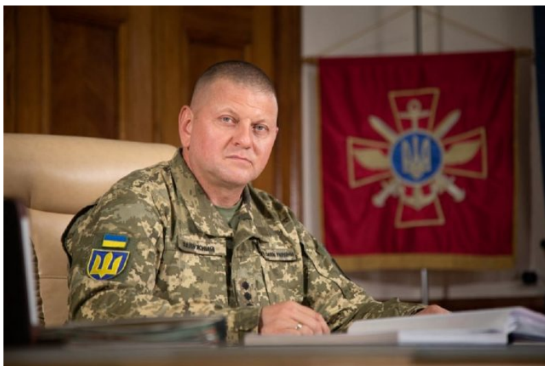
Valerij Zalužný, zřejmě již bývalý velitel AFU a náčelník GŠ

Od okamžiku zmizení Zalužného převzal řízení bojových operací AFU šéf ukrajinské vojenské rozvědky Kyrjlo Budanov, který je podle ruské vojenské rozvědky (GRU) hlavním architektem teroristických útoků v Rusku již od minulého roku a útoky na Darju Duginu, ale i na Vladlena Tatarského byly řízeny Budanovem a jeho ukrajinskou rozvědkou (GUR). Pozor, nezaměňovat ukrajinskou GUR a ruskou GRU! Problém je v tom, že až do zmizení Zalužného se jednalo o teroristické útoky v Rusku provedené malými skupinami osob, ale nešlo o organizované bombardování a střílení raket na ruské pohraniční regiony.