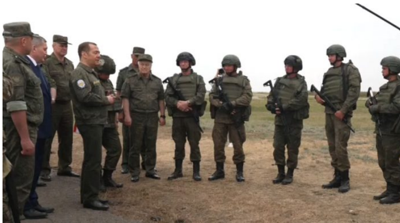
Dmitrij Medveděv na polygonu v Belgorodské oblasti

Změna speciální vojenské operace na proti-teroristickou ale znamená, že se změní i zapojení Ruska v této operaci a cílem se stane likvidace Volodymyra Zelenského, který se stane terčem k likvidaci, a to navzdory svému židovskému původu, který ho dosud chránil. Pokud o jeho likvidaci rozhodnou Moskevské kanceláře a bude označen jako nepřítel Halachim , potom mu bude hrozit, že dopadne stejně jako v minulosti jiní vysocí židovští politici, kteří zemřeli násilnou smrtí, např. Leiba Bronstein-Trocký.