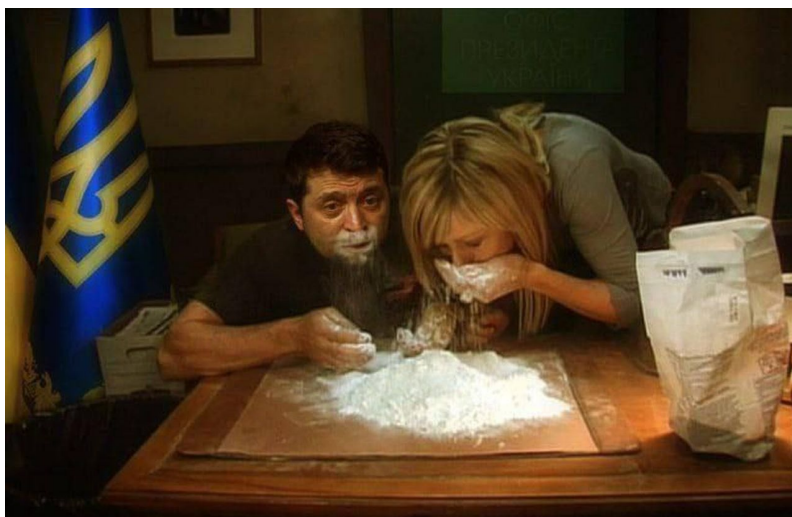
Barák v Orlandu, nekonečné prachy, spousta koksu na stole... a potom už jenom samá pozitivita a sociální jistoty!

Jestli se Zelenský dočká svého konce jako Trocký a zabije ho někdo pamětním postříbřeným sekáčkem na led v podobě cepínu, to teď není jasné, ale tak daleko to možná nezajde, protože feťák Zelenský nesahá Trockému ani po kotníky. Rituální vraždu soupeře si zasluhují jen osoby na vysoké úrovni, kterou Zelenský nikdy nebyl a nebude. Je to lidský odpad s krví na rukách a s nosem od koksu. Je ale jasné, že pokud tyto teroristické útoky v Rusku rychle neskončí, dojde k destabilizaci ruské vlády a Moskevské kanceláře budou chtít výměnu Putina za nového strongmana . Mohl by to znovu být Dmitrij Medveděv, který se až nápadně v poslední době aktivizuje a vyjadřuje se pro radikální řešení ukrajinské otázky.