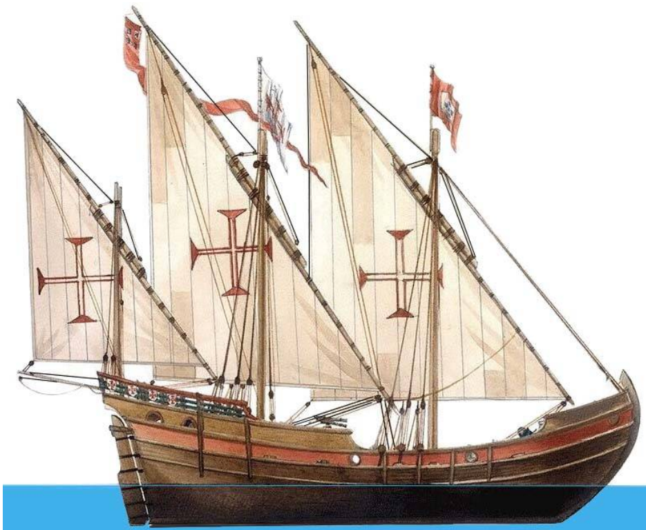
Portugalská caravel latina. Rýže. A. Sheps

No, kdo neví, nebo spíše ze školy je známo, že hlavní lodí éry Velkých geografických objevů byla karavela. Ve skutečnosti to však není tak úplně pravda.