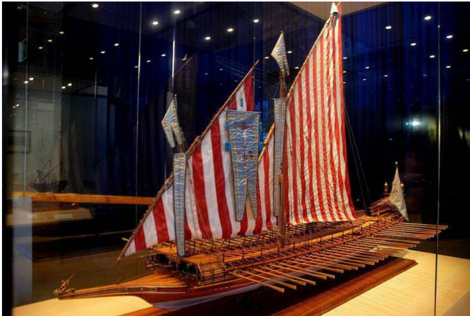
Model Realu Madrid. Námořní muzeum. Barcelona.

No, kdo neví, nebo spíše ze školy je známo, že hlavní lodí éry Velkých geografických objevů byla karavela. Ve skutečnosti to však není tak úplně pravda.