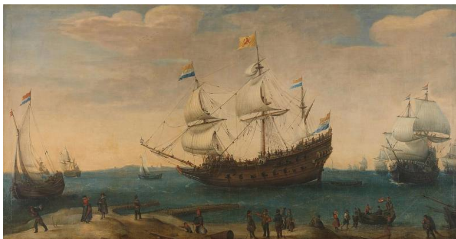
Holandská galeona z počátku 16. století. Malíř Hendrik Cornelis Vrom (1563/1640–1630). Národní muzeum Nizozemska, Amsterdam

Bylo potřeba nějak zvýšit stabilitu caracca, což se podařilo. A tak se objevila slavná galeona - loď, která se stala symbolem rivality mezi Anglií, Francií a Španělskem na mořích a oceánech v 16.-17. století.