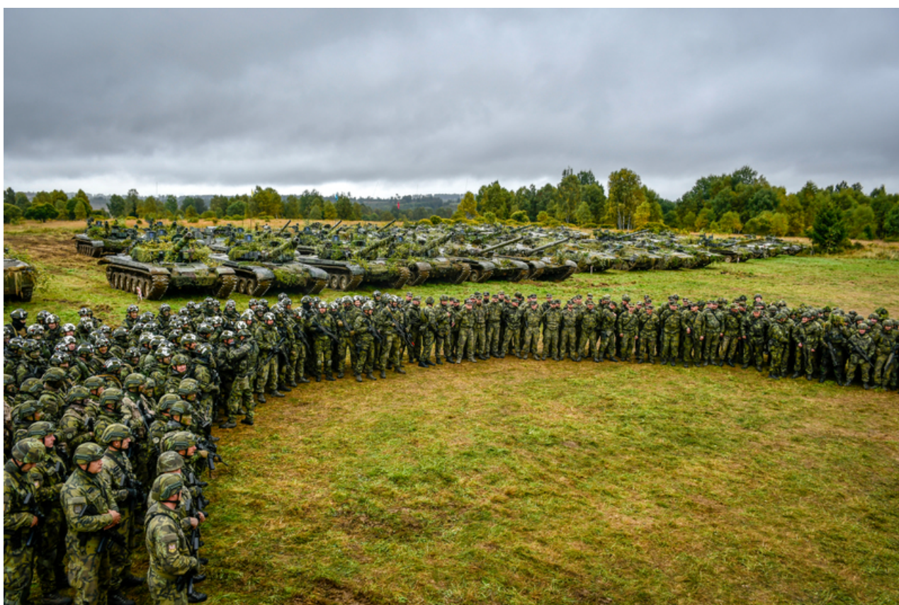
Foto: Armáda by podle gen. Řehky měla rozhodně zůstat vševojsková (ilustrační foto)

a ke schopnostem naší vlastní armády. Musíme být připraveni po určitou dobu bránit naše území samostatně, protože pomoc spojenců nebude okamžitá a budeme muset vydržet i týdny s tím, co budeme mít. V souvislosti s nasazením našich jednotek v posledních letech se může zdát, že jsme spíše expediční armáda, ale není to tak. Armáda měla a má stále vševojskový charakter, pouze jsme museli utlumit některé kapacity. Tím jsme se například dostali do deficitu v oblasti protivzdušné obrany, přitom jsme v dostřelu ruských raket. Nicméně na druhou stranu se nám podařilo tyto kapacity zachovat, byť třeba hodně redukované. Je už dávno ověřené a i z pouhé logiky věci vyplývá, že posilování existující kapacity je vždy mnohonásobně snazší, rychlejší a levnější než na zelené louce vybudovat něco, co jsme zrušili. Dnes, kdy je patrné, že velký konvenční konflikt v Evropě není až tak nereálný, je jasné, že to bylo dobré rozhodnutí.