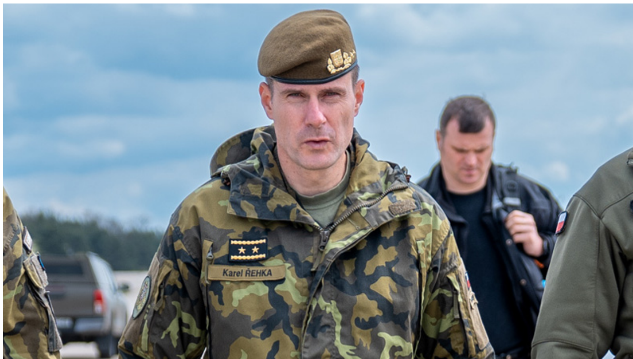
Foto: Náčelník Generálního štábu AČR gen. Karel Řehka

Po třiceti letech novodobé historie AČR se nabízí obecná otázka: V jakém stavu armáda dnes je a co jí chybí, aby byla v optimálním stavu?