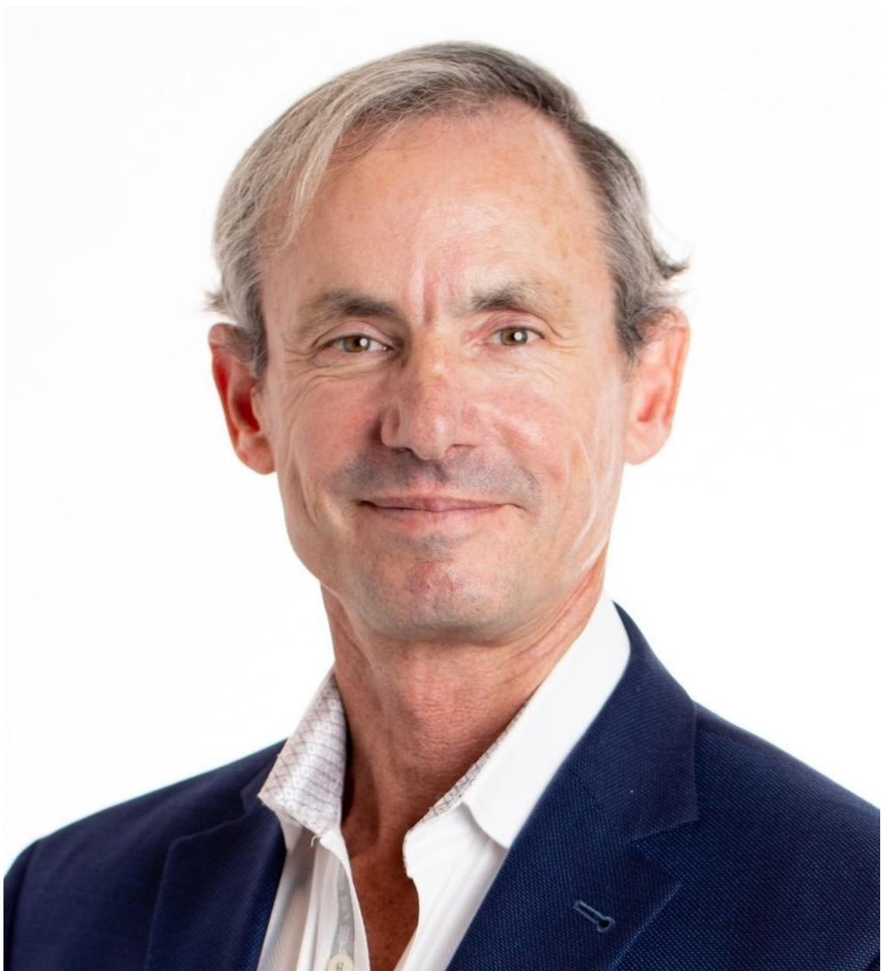
Bývalý náměstek náměstka ministra obrany pro zpravodajství Christopher Mellon.

Mellonříká, že jakmile členové Kongresu získají větší povědomí o informacích poskytovaných jejich zaměstnancům a generálnímu inspektorovi, budou schopni rychle zjistit pravdu, pokud k tomu budou mít vůli.