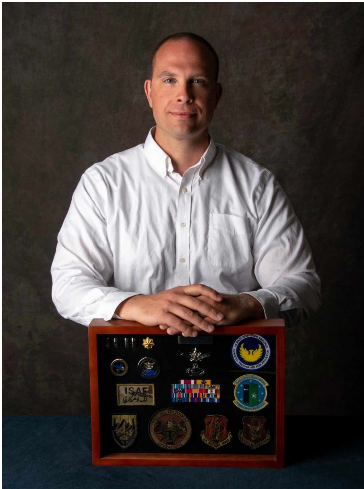
David Charles Grusch

Pracovní skupina byla založena, aby prozkoumala to, co se kdysi nazývalo „neidentifikované létající objekty“ nebo UFO, a nyní se oficiálně nazývá „neidentifikované anomální jevy“ nebo UAP.