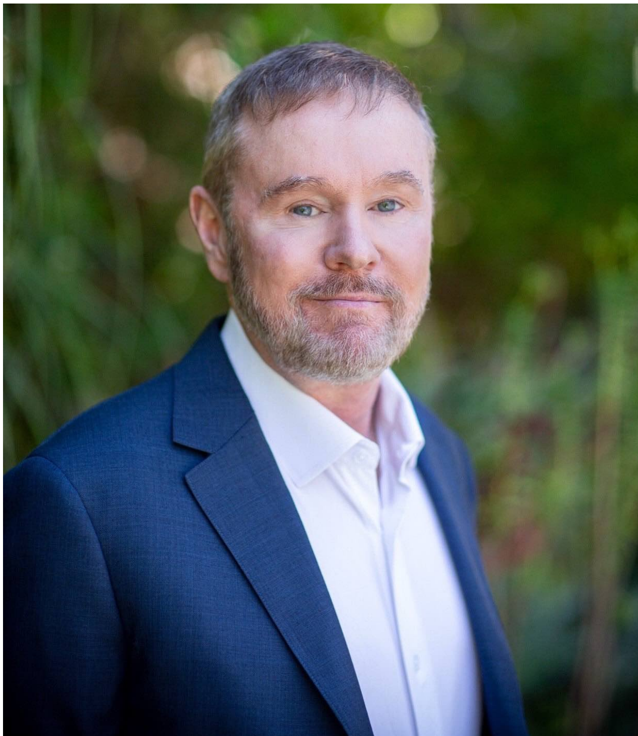
Stanfordský profesor Garry Nolan

„Lidská civilizace byla naprosto přeměněna něčím tak malým, jako je zrnko křemíku nebo germania – což vytvořilo základ integrovaných obvodů, které jsou základem výpočtů a nyní dokonce i umělé inteligence,“ řekl Nolan.