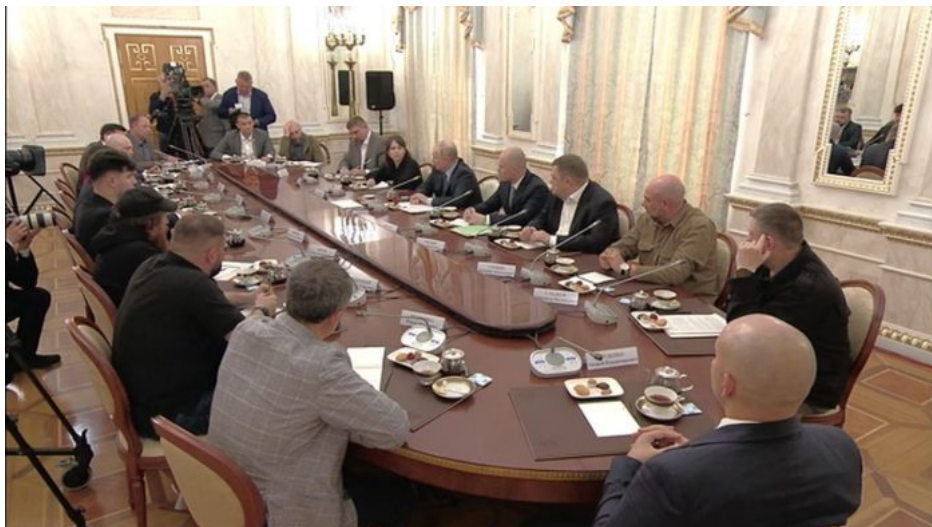
Setkání s novináři v Kremlu

Za dobu 8 let přijala Ukrajina na pokyn amerických poradců sérii brutálních a xenofobních protiruských zákonů, na zákaz ruštiny na úřadech, ve školách, v obchodním styku a nakonec i v tisku. Byly přijaty zákony na zákaz ruských škol na Ukrajině, kde se vyučovalo rusky. Byl přijat zákon o ukrajinském národě, který označuje Rusko a Sovětský svaz za okupanty a na základě zákona jsou obce a města povinny odstraňovat všechny pomníky a sochy připomínající vítězství Rudé armády nad nacisty na Ukrajině. Ukrajinská junta těmito zákony začala páchat kulturní a sociální genocidu ruského etnika a dokonce i genocidu fyzickou, když zakopaná ukrajinská armáda 8 let střílela a dodnes střílí na civilní budovy v Doněcku a v dalších městech na Donbasu.