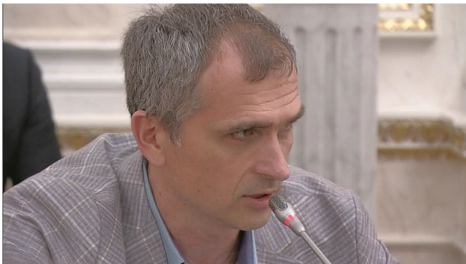
Setkání se zúčastnil i uznávaný vojenský analytik z Krymu Jurij Podoljak

jak daleko půjde Ruská armáda? To záleží na mnoha okolnostech. Zejména se uvidí, co se začne dít v Kyjevě ve chvíli, až se opravdu ukáže, že probíhající ofenzíva AFU má jalový potenciál.