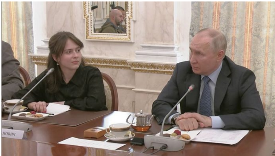
Vladimir Putin při rozhovoru s žurnalisty a válečnými zpravodaji

Jenže Kreml tuto léčku měl dopředu přečtenou, bylo mu jasné, že cílem teroru na Ukrajině proti ruskému etniku je vyprovokování Ruska, aby vyslalo na Ukrajinu armádu. Rusko nebylo v roce 2014 připraveno čelit zdrcujícím sankcím západu. Rusko nebylo v roce 2014 potravinově soběstačné, dováželo dokonce mléčné výrobky, dokonce i obilí. Sankce tohoto dnešního rozměru, které západ uvalil vloni, by Rusko v roce 2014 ekonomicky a hospodářsky opravdu položily.