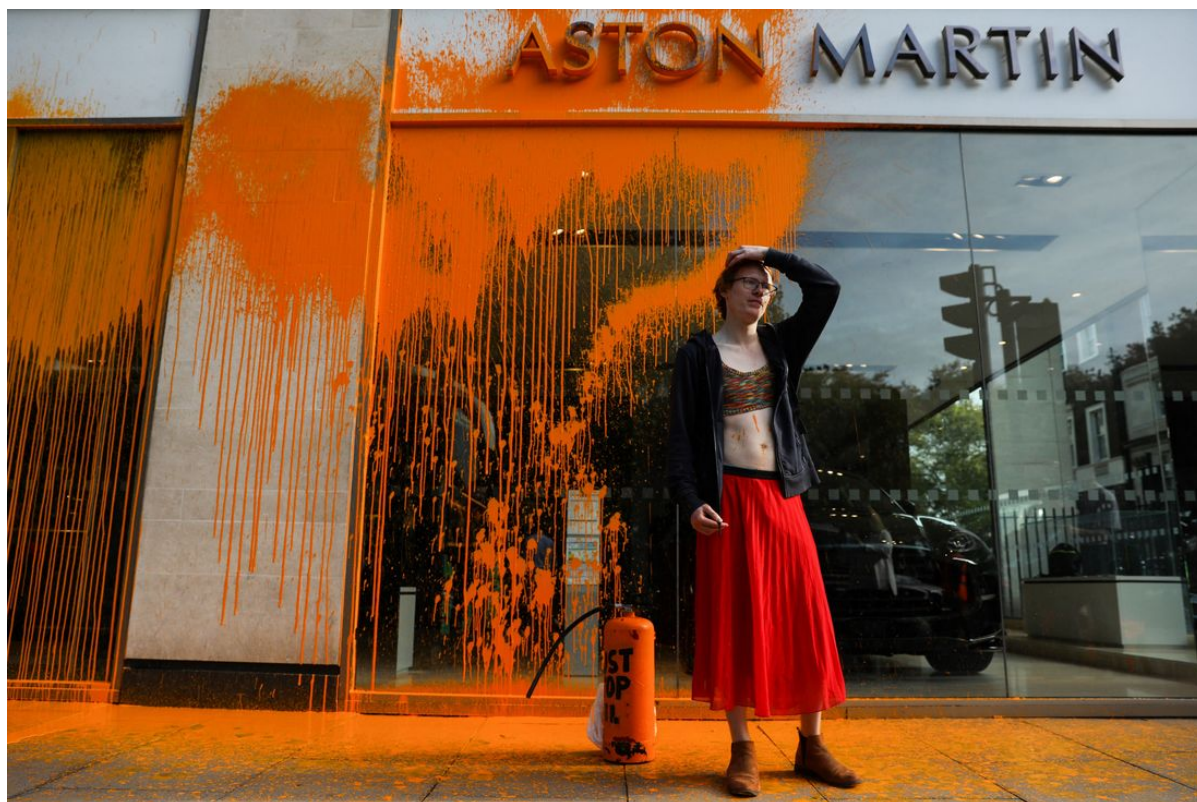
Člen radikální ekologické skupiny Just Stop Oil poté, co potřísnil barvou výlohu autosalonu Aston Martin v centru Londýna, 16. října 2022.

Tuto taktiku používají protestní skupiny jako Extinction Rebellion, Just Stop Oil a Insulate Britain, které volají po zastavení těžby ropy a plynu. Nejaktivnější je v tomto směru aktivistická organizace Just Stop Oil, proslulá vandalskými činy jako polití obrazu Vincenta van Gogha v Národní galerii, potření sochy krále Karla III. v muzeu voskových figurín Madame Tussauds, narušením fotbalových utkání nebo postříkáním budov tajné služby MI5, centrální banky a dalších institucí.