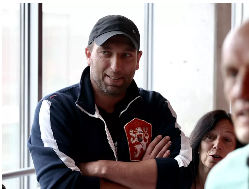
Čermák na chodbě u červnového soudního líčení.

Šířené dezinformace: Na sociálních sítích zveřejnil zprávu, že se chystá plán na diskreditaci neregistrovaného léku ivermektin. A to údajně „pomocí úmrtí (tedy vraždy) několika pacientů, kteří jej budou užívat“. Právě toto tvrzení označil prvoinstanční soud za poplašnou zprávu.