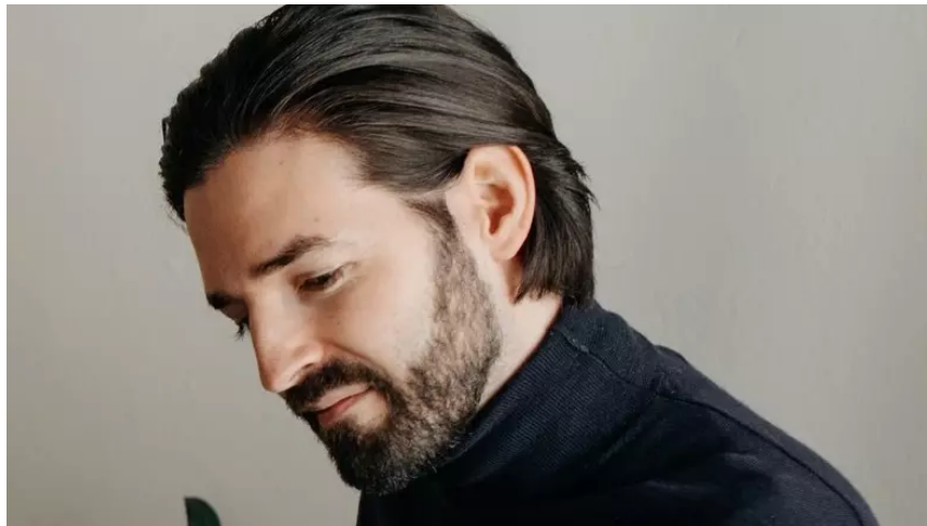
Ondřej Geršl sám přiznává, že jeho web AC24.cz není nejdůvěryhodnější.

Přehled největších dezinformátorů v Česku podle jejich dosahu: