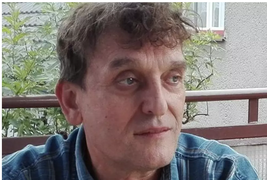
Jan Macháček založil Společenství legitimních věřitelů České republiky.

český stát nefunguje. Sám ale šířil nesmysly o takzvaných chemtrails, tedy že dopravní letadla tajně rozprašují nebezpečné látky v ovzduší.