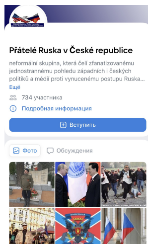
Skupina Přátelé Ruska v České republice .

Další skupina na VKontaktě s podobným názvem, Přátelé Ruska v České republice , má přes 700 uživatelů. Podle jejich vlastního popisu jde o „neformální skupinu, která čelí zfanatizovanému jednostrannému pohledu západních i českých politiků a médií proti vynucenému postupu Ruska, které hájí přirozené zájmy své země, ruských obyvatel, ale ve svých důsledcích i rozumnou strategickou rovnováhu ve světě.“ Správce skupiny pravidelně sdílí zprávy prokremelského projektu Ruskaja Vesna , jež do češtiny překládá uživatelka Božena Weitingerová.