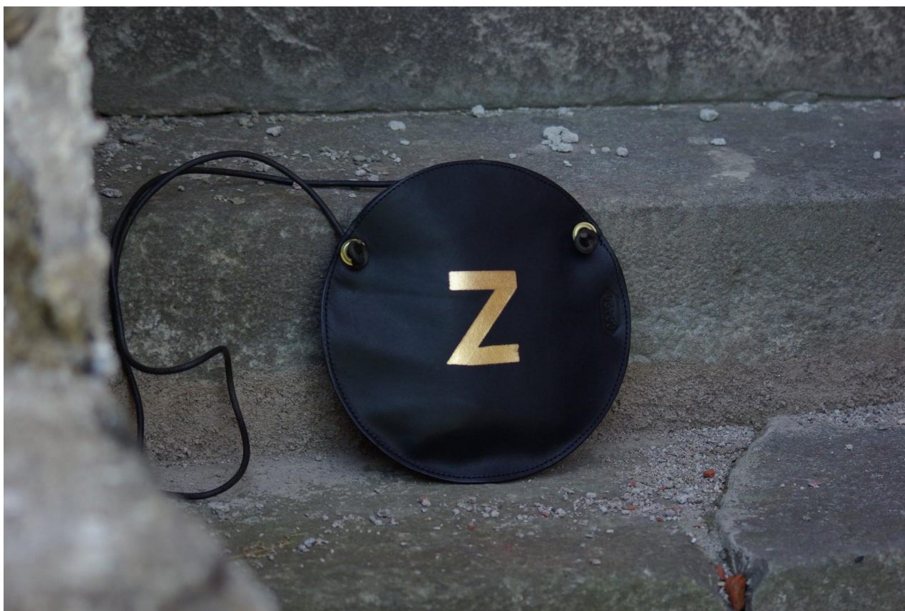
Kožená kabelka s písmenem Z z dílny Petry Boudníkové.

Podobné sny má i Petra Boudníková. V komunitě lokálních výrobců kožených doplňků na severu Čech je dobře známá, řemeslu se věnuje přes 15 let. Její provozovna sídlí v malém městečku Hostinné v podhůří Krkonoš. Zpočátku se zaměřovala na výrobu postrojů a dalšího příslušenství určeného pro koně, které také chová. Později své produkty rozšířila o ručně vyráběné kabelky a brašny. Pod značkou Kertag a heslem „Divočina ve světě uniformity“ prodala za dobu své řemeslné aktivity více než 12 tisíc výrobků.