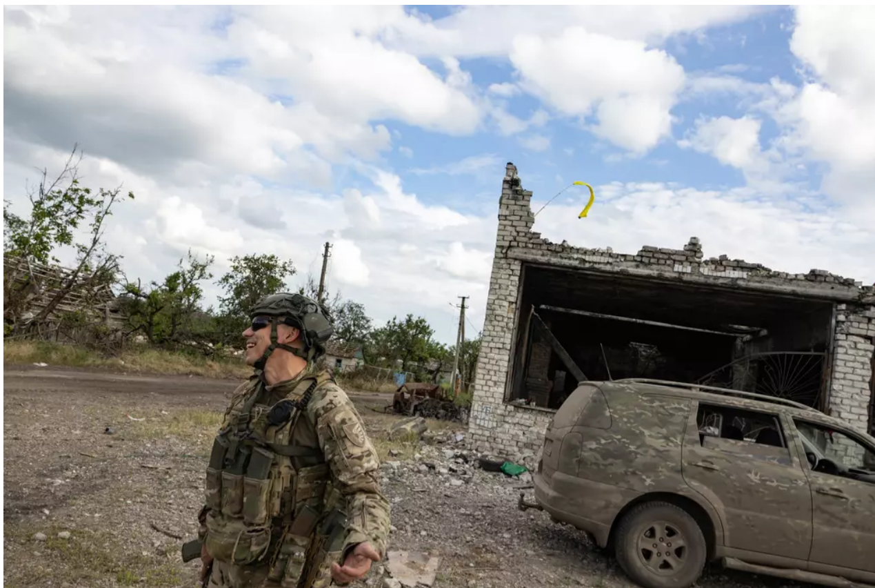
Neskučně znovu pod ukrajinskou vlajkou

V Neskučném není nikdo. Ani pes či kočka, natož lidé. Jen ztichlé ruiny. Ale ticho v Neskučném není. Každou chvíli se rozežmí výstřely z děl, která ještě, zdá se, neřekla v této vesničce poslední slovo. Vesnice zatím není dočištěná. Na zemi i uvnitř budov jsou rozmístěny granáty a miny. Každý krok si musíme dobře rozmyslet a šlapat jen na pevnou půdu nebo asfalt, kde není vidět nic podezřelého.