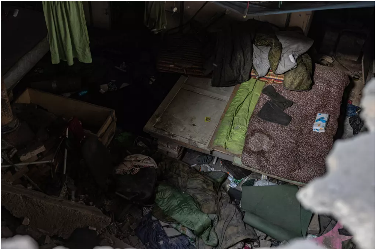
Podzemní kryt ruských vojáků v Neskučném

V podlaze zeje díra, která nám dává nahlédnout do podzemního bunkru Rusů, kde se schovávali před ostřelováním. Na matracích stále leží spacáky, kusy uniforem, zbytky výstroje. Jakýsi hadr je tu ponechán symbolicky ve tvaru Z, což je jistě náhoda, ale symbolická. V tom všem obrázku zkázy mi náš průvodce ukazuje na stočenou gumu válející se poblíž granátu. „Takhle vypadá ruské škrtidlo,“ říká opovržlivě.