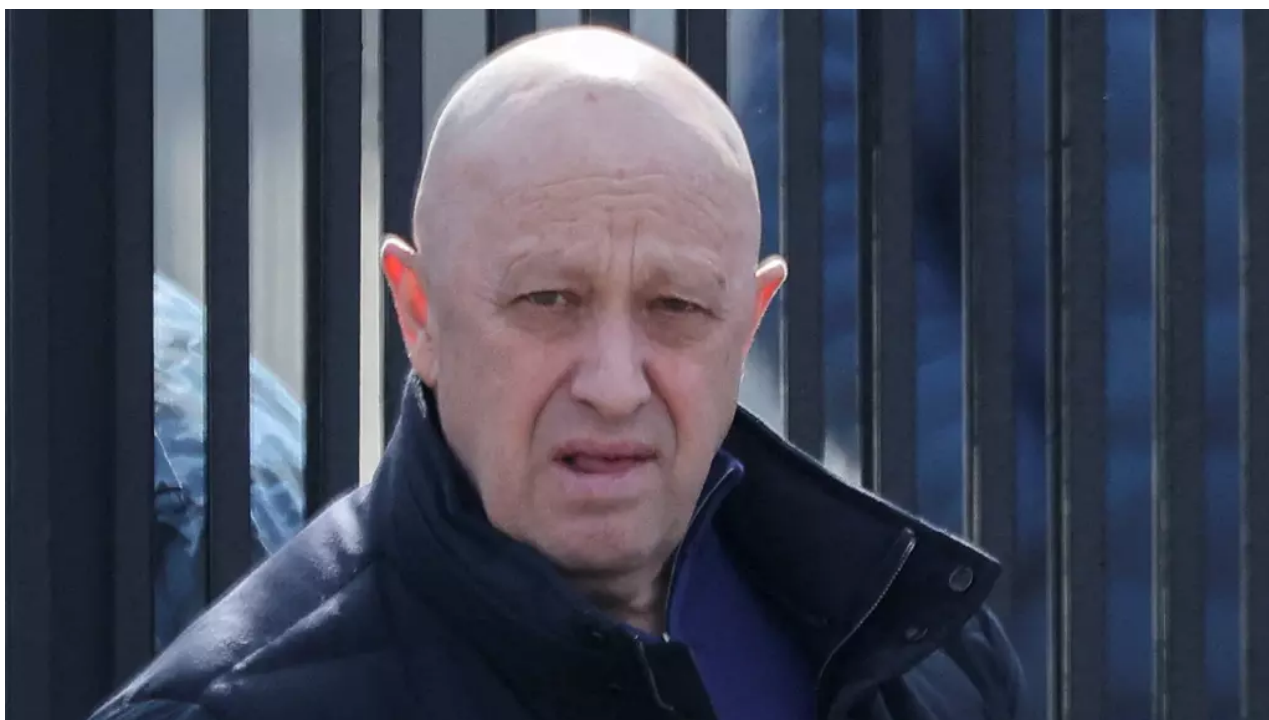
Šéf ruských žoldnéřů Jevgenij Prigožin

Majitel Wagnerovy skupiny Jevgenij Prigožin obvinil ruskou armádu z útoku na své žoldnéře. Úder v týlovém táboře wagnerovců si prý vyžádal mnoho mrtvých, uvedl portál Meduza s odkazem na Prigožinův Telegram. Wagnerovci dle svého majitele v blízké budoucnosti rozhodnou o tom, jak na toto „zvěrstvo“ odpoví. BBC upozornila, že hlas na nahrávce nemusí patřit Prigožinovi.