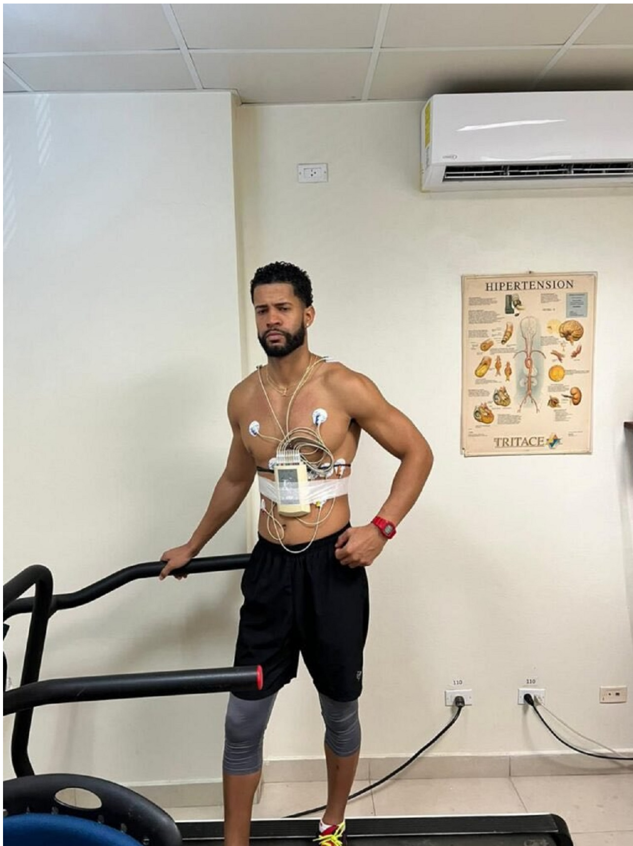
basketbalista Oscar Cabrera Adames, který zemřel na infarkt poté, co vinil očkování za svůj zdravotní stav