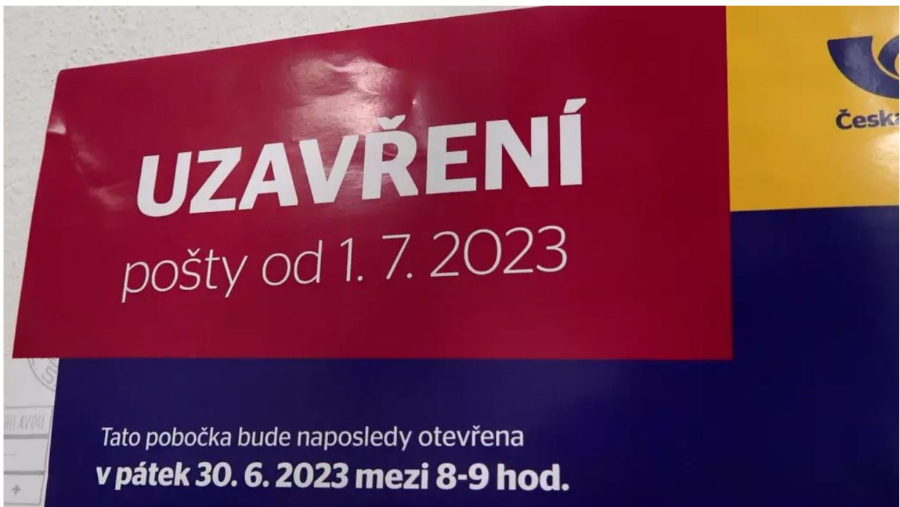
Uzavření pobočky České pošty v Karlíně