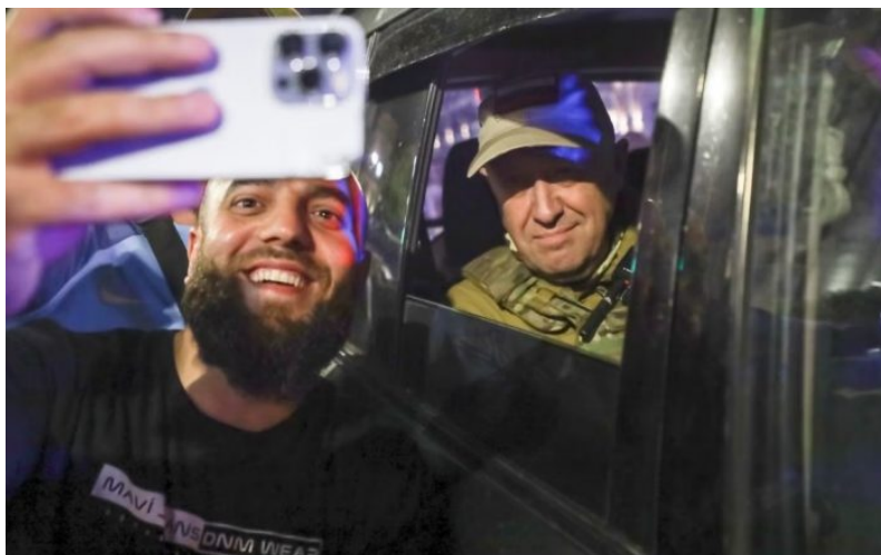
Jevgenij Prigožin při odjezdu z Rostova na Donu jako celebrita

Americký list Newsweek uvedl [2], že odhalení tajné schůzky Prigožina s Putinem v Kremlu pouhých 5 dní po údajném puči vyvolává otázky, jak dalece lze věřit oficiální verzi Kremlu o puči, protože odhalení tajné schůzky odkrývá úplně jiné vztahy mezi Putinem a Wagnerovci, které lze jen stěží označit za nepřátelské nebo nebezpečné, protože jen málokdo uvěří pohádce a příběhu o tom, že prezident Putin si pouhých 5 dní po údajném skutečném puči pozve do Kremlu nejen Prigožina, ale úplně všechny pučisty, úplně celou skupinu Wagner , aniž by na okamžik měl obavy o svou bezpečnost vzhledem k tomu, jak krátká doba od puče proběhla.