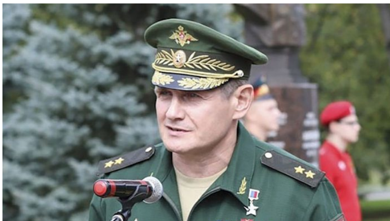
GenPlk. Michail Teplinský, nový velitel SVO na Ukrajině

V neděli se totiž do zahraničního tisku [3] dostaly už otevřeně z Kremlu informace o tom, že Vladimir Putin krátce po tajné schůzce v Kremlu s Wagnerovci sesadil v genštábu z funkce velitele SVO náčelníka generálního štábu Valerije Gerasimova. Jak už jsme v předstihu minulý týden na Aeronetu informovali, jeho místo velitele speciální operace na Ukrajině převzal generálplukovník Michail Teplinský.