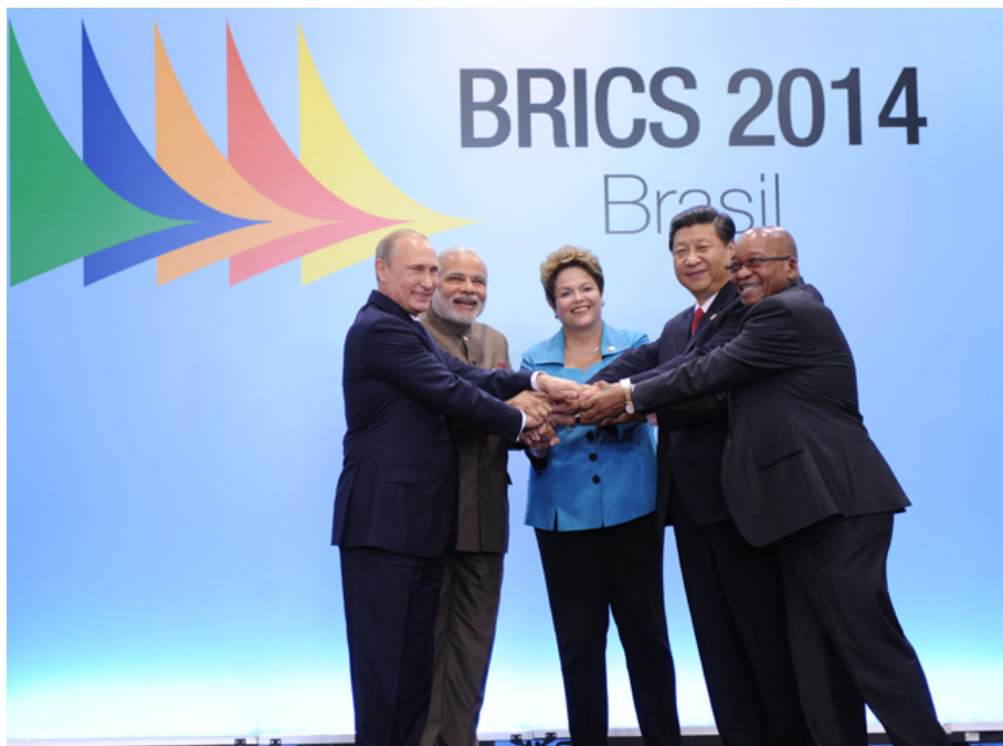
Rusko zahájilo proces odchodu od dolaru již v roce 2014 po připojení Krymu a proces převzal poté i BRICS

Všechno se změnilo po uvalení sankcí na Rusko, které vedly k odpojení celé země od SWIFT systému a jeho mezinárodního bankovního clearingů a ke stovkám dalších sankcí, které by Čínu ekonomicky naprosto položily. Zatímco Rusko se na tyto procesy odpojení připravovalo již od roku 2014, takže uvalení sankcí nakonec Rusko nijak výrazně nepoškodilo, v případě Číny by se jednalo o naprostou katastrofu a kolaps čínské ekonomiky. Peking si s hrůzou uvědomil, že kolektivní západ neblafoval a opravdu je schopen a připraven nepohodlnou nepřátelskou zemi úplně odpojit, na což Čína na rozdíl od Ruska není dosud připravena.