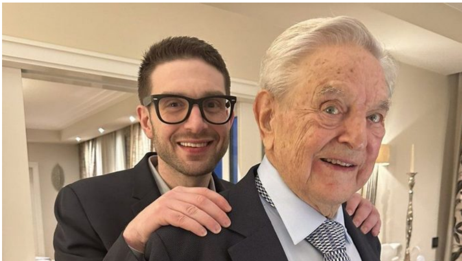
Alexander Soros a jeho otec George

A to, co probíhá teď na Slovensku v těchto dnech, de facto měsíc před předčasnými volbami do slovenského parlamentu, je v podstatě puč silových a mocenských složek pod kontrolou této dosazené prezidentky, jak varují slovenské opoziční strany v čele s Ficovou stranou SMER.