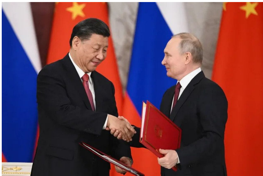
Xi Jin-Ping a Vladimir Putin

Zadržení je proces vlivových operací americké moci a lobbistů, včetně neziskovek, na dosazení pro-amerických politik a politických stran do vedení těch států, kde má silné postavení Čína. Tyto neziskovky mají za úkol vyvolat v těchto zemích Afriky a Asie stejné procesy, jaké vyvolaly po roce 1989 v Evropě. Tedy procesy indukce silné fóbie mezi obyvatelstvem proti zemí, kterou chtějí Američané zadržet. V Evropě to bylo Rusko, takže celých 30 let jely v prostoru Evropy a EU postupně zesilující rusofobní procesy. A totéž se začne odehrávat teď v prostoru Asie a Afriky, kde se Američané začnou snažit o indukci a roubování silné sinofobie, tedy nenávisti vůči Číně. Samozřejmě i v prostoru EU, ale již bez potřeby vlivů Open Society.