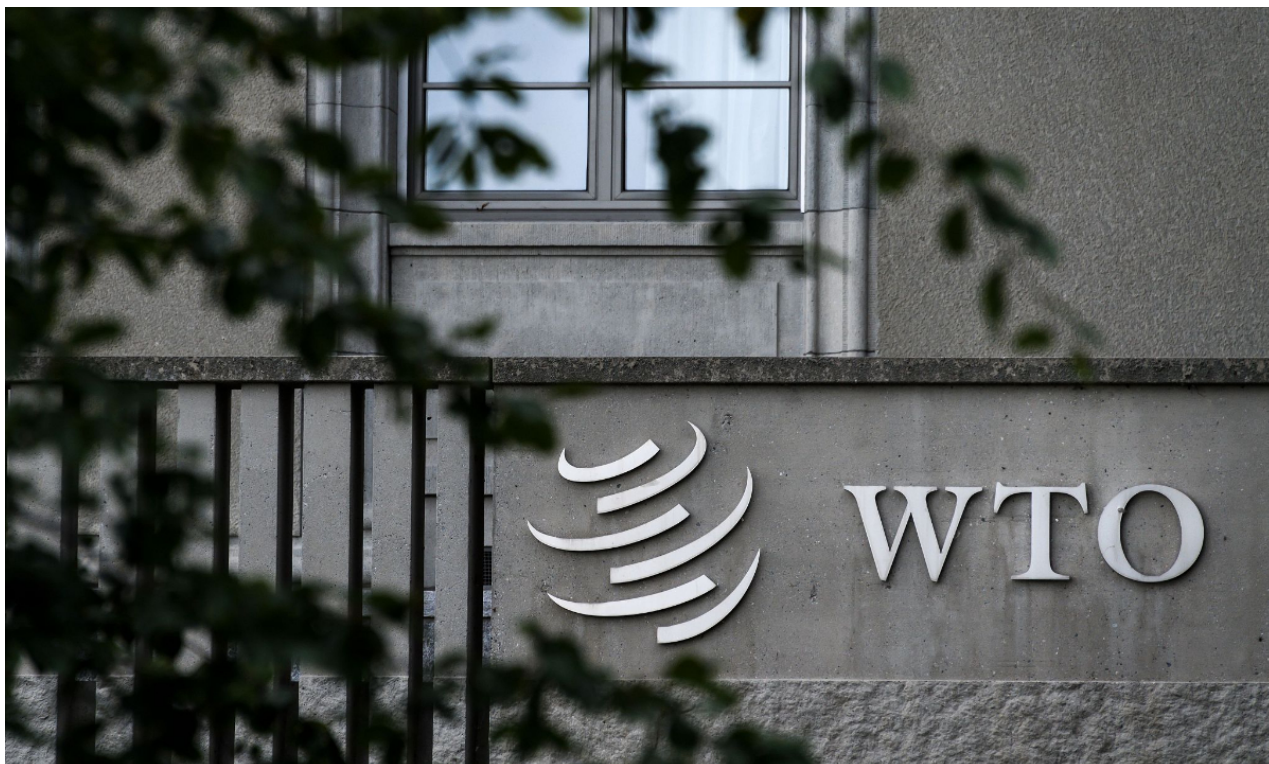
Nápis WTO na jejím sídle v Ženevě

Oznámení USA o předběžných antidumpingových clech na dovoz pocínované oceli ze tří zemí na základě petice jediné firmy se nespravedlivě zaměřuje na Čínu s podstatně vyšší celní sazbou na její dovoz, což je pravděpodobně v rozporu s pravidly WTO, čínští analytici řekl v pátek.