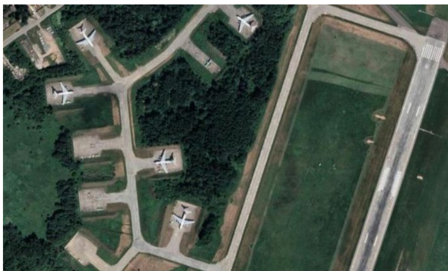
Snímek letiště ve Pskově s letadly IL-76 pod otevřeným nebem

Mezi Pskovem a Ukrajinou leží navíc obrovské území Běloruska, kde jsou rozmístěné PVO systémy paranoidního Lukiho, který čeká na jakoukoliv záminku útoku na Bělorusko z Ukrajiny, aby mohl do Kremlu ihned nahlásit, že Ukrajina narušila běloruský vzdušný prostor. I kdyby Ukrajina měla nějaké neznámé super-drony s doletem okolo 800 km, tak přes území Běloruska by to nešlo a už vůbec ne oklikou přes Rusko a okolo Běloruska (trasa asi 1 000 km).