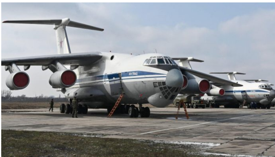
Stojánka letadel IL-76

Pokud by došlo k eskalaci a k použití taktických jaderných zbraní, následovala by zřejmě všeobecná mobilizace, krátký 14-denní výcvik a odvelení na ukrajinský a zřejmě v té době i běloruský front. První by byly mobilizovány nežádoucí a závadové osoby v ČR podle předpisu o tzv. mimořádných opatřeních , které jsou podle našich informací již několik let připravovány, přesně podle modelu ukrajinské mobilizace, která vloni na jaře podle seznamů odváděla na frontu především ukrajinské opoziční politiky, opoziční novináře píšíci proti Zelenskému a jeho vládě, publicisty, občanské aktivisty proti korupci a další.