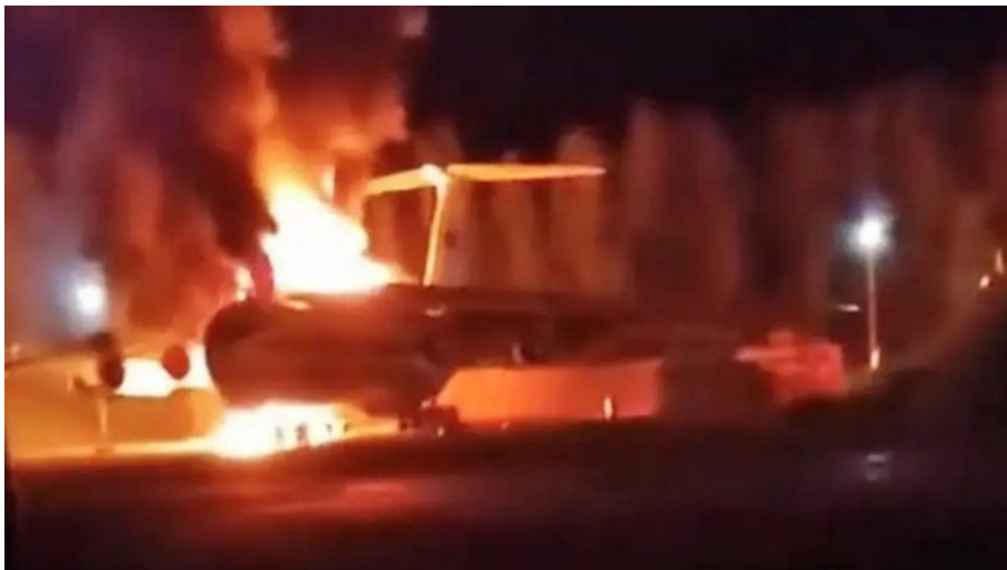
Svěddecká fotografie hořícího IL-76 na letišti ve Pskově

V této fázi selhávající ofenzívy AFU na Ukrajině se hraje jen o jedinou věc: Jak zapojit NATO do války proti Rusku napřímo, aby nedošlo ke zhroutilí a kapitulaci Ukrajiny? Dobrovolně se k válce proti Rusku země NATO připojit nechtějí, ale pokud budou postaveny před hotovou věc, že Rusko vybombardovalo v Estonsku nějakou základnu v odvetě za útok na letiště ve Pskově, tak nebudou prostě moci couvnout a budou muset do konfliktu vstoupit společně s NATO. V takovém případě by v ČR začaly okamžitě mobilizace branných sil, všichni vojáci AČR, vojáci z povolání, vojáci v záloze, vojáci prošlí ZVS do konce roku 2004 a další rezervní zálohy.