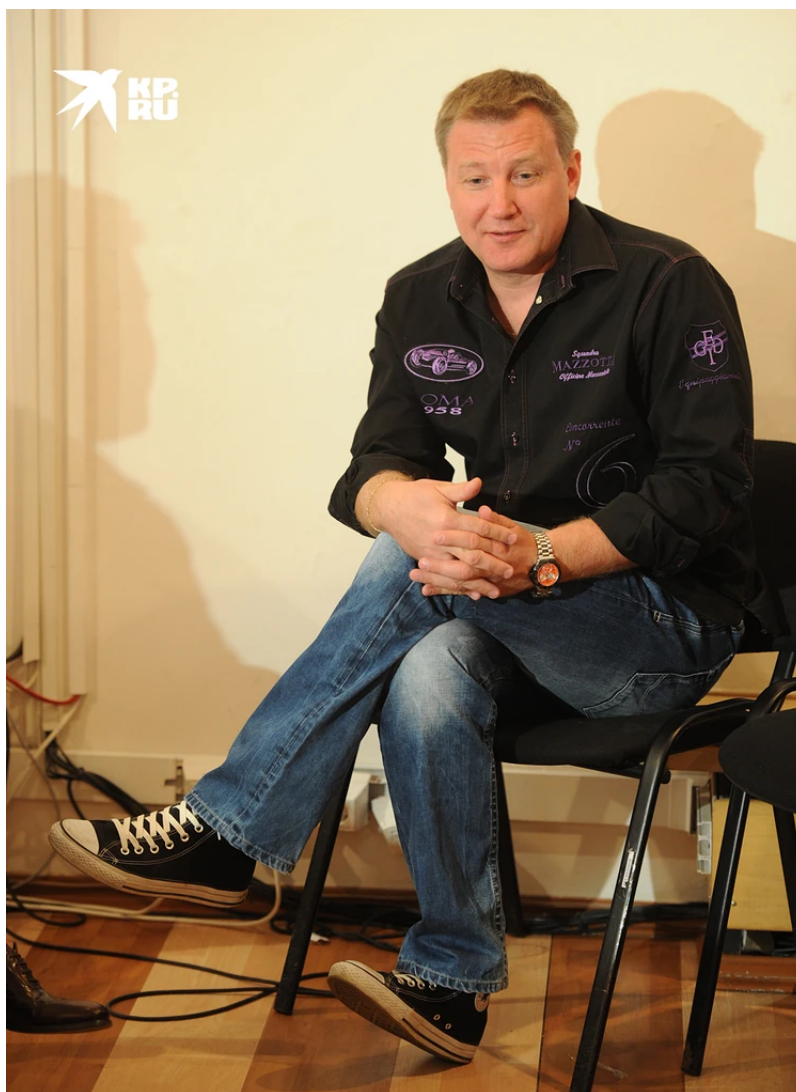
Spisovatel sci-fi Vadim Panov

– Ne každý chápe, co je to hodina dějepisu ve škole. Mnoho lidí si myslí, že dítě si přečte učebnici, zaklapne ji a běží na net. Ale všechno je uloženo v jeho podvědomí. Existuje obecné informační pole, v němž jsou další fakta, která nevyvolávají otázky.