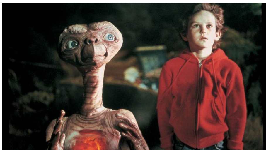
Programovací film Stevena Spielberga z roku 1982 E.T. Mimozemšťan

Manifestace dvou mrtvol mimozemšťanů v mexickém kongresu žádný šok nevyvolala. Lidé jsou totiž díky programovacímu filmu Stevea Spielberga z roku 1982 na obličeje ube a jejich větší odnože ebe již připraveni. Většinu lidí přitom nedojde, že ten film byl programovacím videem, které mělo děti od útlého věku připravit na setkání s ebe entitami, aby se jich nebáli. Vidíte, jak pracují progos .