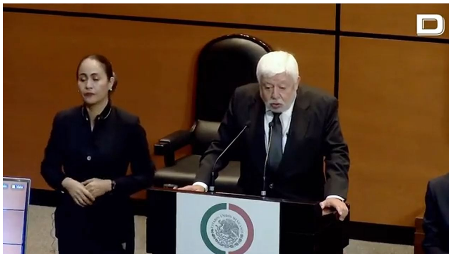
Tisková konference v mexickém parlamentu

Snaha o zabránění jevu "Vyššího muže" je tedy pro progos pochopitelná. Lidstvo přestane poslouchat správce vyvoleného národa, pokud spatří vyšší moc, mocnější sílu v podobě mimozemské supercivilizace s obrovskou silou, se kterou se pozemská světová vláda v podobě Komise 300 neodkáže nijak vyrovnat. Snaha o snížení populace na této planetě je požadavek Syndikátu na progos . Na planetě nechtějí více než 500 milionů goyos , ale nemá to noc společného s ekologií.