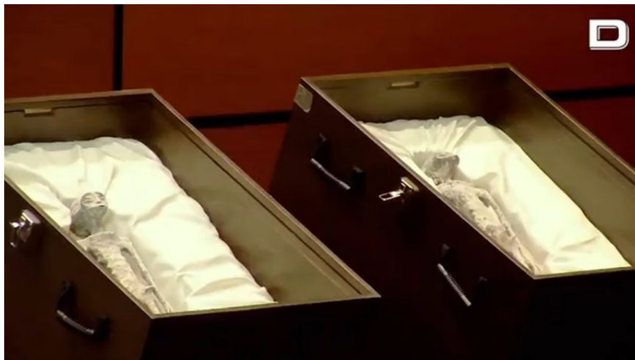
Uběhlo 41 let od premiéry E.T. Mimozemšťan, tehdejší děti dospěly a teď mají mimozemšťany na očích doopravdy, a není to film

Panika nevypukla, všude je klid. Programovací video Stevena Spielberga E.T. mimozemšťan z roku 1982 zabralo. Lidé se nevyděsili a nebojí se. A na Apple TV už proto spustili nový programovací seriál – Invaze. A předtím celá řada programovacích filmů – Elysium, Interstellar, Prometheus, Terminator, Den nezávislosti, Moonfall a celá řada dalších, s neustále se opakujícími narativy a motivy pokročilých civilizací a ne tak docela přátelských vztahů uvnitř Syndikátu. Církev se nezhroutila. Nejsme ve vesmíru sami. A nic se nestalo. A proč se globalisté rozhodli, že v Mexiku oznámí, že nejsme ve vesmíru sami, na datum 12. září? No, to má velký přesah. Den 12. září totiž připomíná Bitvu u Marathonu.