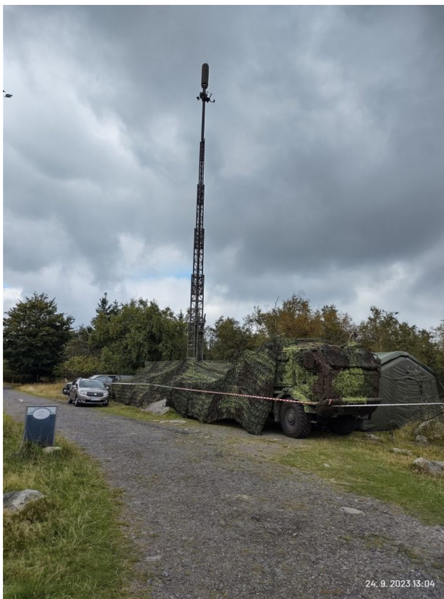
Pasivní radiolokátor VERA-NG na Sněžníku u Děčína nedaleko rozhledny

míru obvykle neprovádí, pokud jde o radar rozmístěný jen preventivně a pro potřeby civilního zabezpečení. Je možné, že jde o součást nějakého cvičení AČR, i když lokace radaru není v prostoru žádného VVP.