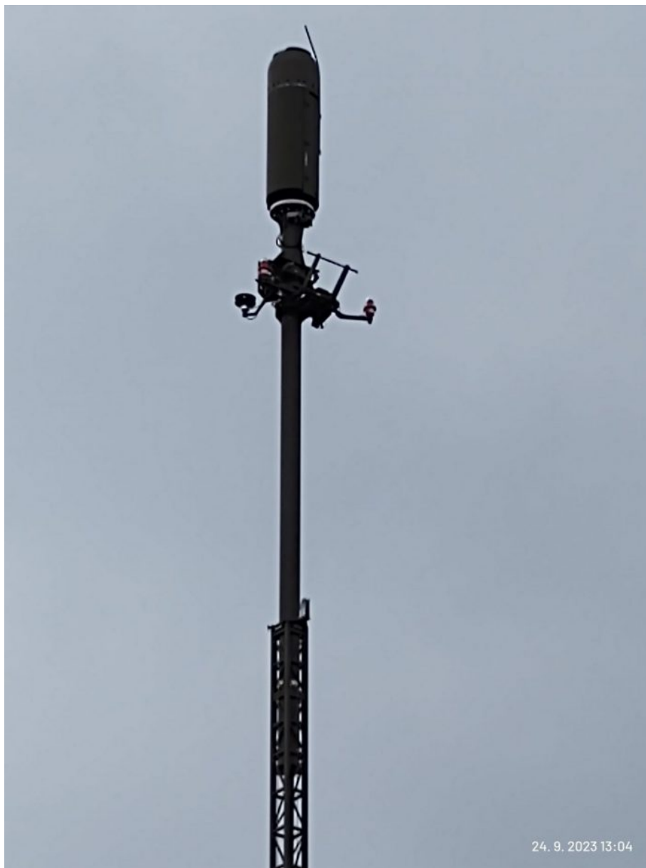
Detail radioteleskopu VERA-NG

VERA-NG je český a nejmodernější pasivní radiolokátor od výrobce ERA Pardubice a na Sněžníku je podle našeho vojenského zdroje rozmístěn proto, aby monitoroval případné příletové dráhy z Kaliningradské oblasti. VERA-NG má operační dosah přibližně 500 km, náš zdroj nám prozradil, že v nočních hodinách kvůli radiovému útlumu okolí je dosah pasivního systému VERA-NG pro naslouchání radioelektronické komunikace vzdušných objektů až ze vzdálenosti 800 km.