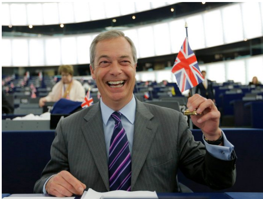
Nigel Farage v Evropském parlamentu

Narovinu a férově prohlašoval, že EU je nereformovatelná organizace a “vězení evropských národů.” Šel prostě programově a otevřeně za tím, aby Velká Británie vystoupila z EU. S tímhle programem ale ani SPD, ani Národní fronta Marine Le Pen, ani nikdo další do EU v roce 2019 nekandidoval, protože volebním mottem byla “reforma EU zevnitř”.