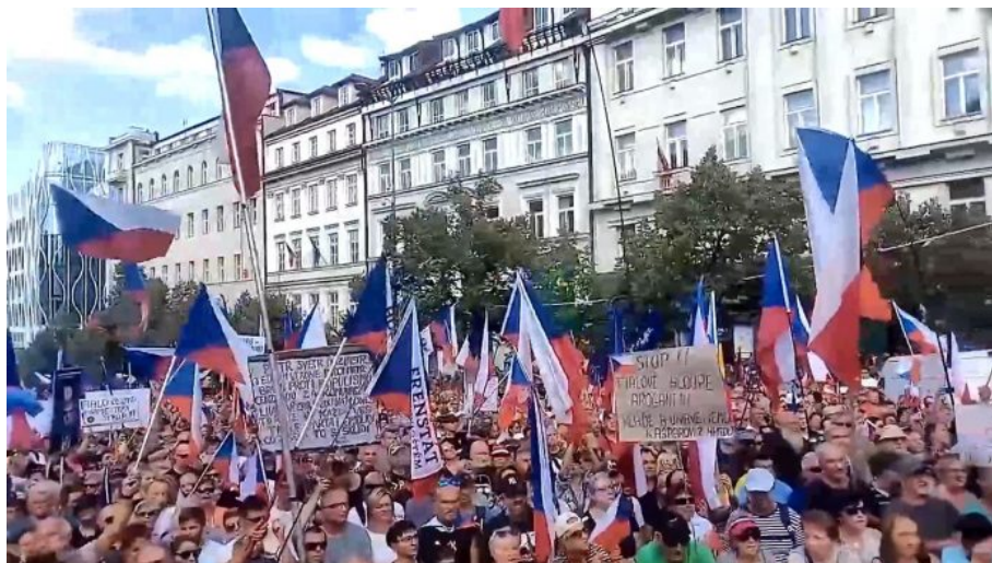
Demonstrace Česko proti vládě, 16. 09. 2023