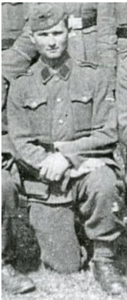
Hunka ve 40. letech 20. století