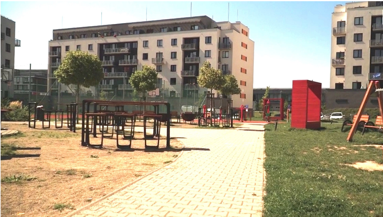
Místo, kde k útoku na dítě došlo

Podle našich informací byli útočník i zraněný chlapec Ukrajinci.