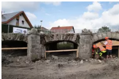
FOTO: Repliku Karlova mostu rozebírají ručně kámen po kameni