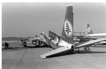
Jeden ze symbolů izraelské invaze do Libanonu: zničená letadla na bejrútském letišti

Libanonská maronitská (křesťanská) vláda se kvůli obavě z narušení křehké rovnováhy mezi jednotlivými náboženskými skupinami a strachu z ohrožení své pozice bránila integraci palestinských uprchlíků do libanonské společnosti. Těžko únosné podmínky v uprchlických táborech naklonily mnohé palestinské uprchlíky na stranu OOP, která se snažila zlepšit jejich sociální a pracovní podmínky. OOP nakonec získala na jihu Libanonu takovou moc, že libanonská vláda ztratila nad touto oblastí zcela kontrolu, takže nemohla zabránit ani útočným vpádům Palestinců do Izraele. V polovině 70. let začala situace v jižním Libanonu nabývat charakteru občanské války mezi Palestinci a křesťanskými falangisty , do níž zasáhla také propalestinská Sýrie, jejíž vojska jižní Libanon obsadila. Po izraelské operaci Litani byla sice syrská armáda nahrazena jednotkami OSN ( UNIFIL ), ani ty však podobně jako libanonská vláda nedokázaly zabránit odpalování palestinských raket na izraelské území, roku 1981 se navíc syrské vojsko do Libanonu vrátilo. [78]