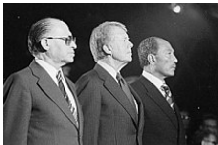
Menachem Begin , Jimmy Carter a Anwar Sadat při vyjednávání míru v Camp Davidu roku 1978.