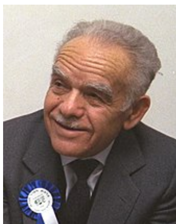
Jicchak Šamir v roce 1991