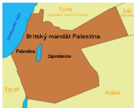
Mapa Britského mandátu Palestina (1920)

Po první světové válce a pádu Osmanské říše svěřila Společnost národů na Pařížské mírové konferenci v roce 1919 Mandát pro Palestinu Spojenému království . Vznikl tak protektorát Britský mandát Palestina , mezi jehož hlavní cíle patřila nápomoc provedení Balfourovy deklarace z 2. listopadu 1917 , která měla zaručit „ zřízení národní domoviny pro židovský národ “. [23] Za podpory agentury britské mandátní správy docházelo k masivnímu přistěhovalectví a vykupování půdy od Arabů, což mělo za následek zrod moderního arabského nacionalismu. Obyvatelstvo této oblasti bylo v té době převážně arabské, avšak Jeruzalém již v tehdejší době byl převážně židovský . [24]