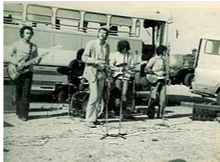
Arik Einstein při představení izraelským vojákům při Jomkipurské válce