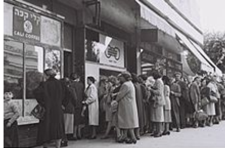
Fronta v Tel Avivu čekající na příděl potravin (1954)

protižidovskými perzekucemi a násilnostmi, jež tam propukly po vyhlášení izraelského státu. V 50. letech orientální Židé tvořili dokonce víc než polovinu židovských imigrantů, což způsobilo dramatickou změnu etnického složení izraelského obyvatelstva a jeho orientalizaci. [45]