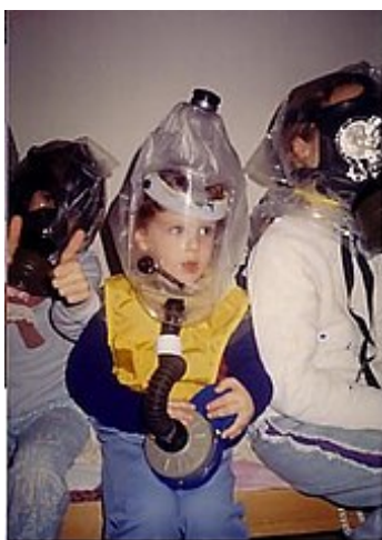
Protichemické cvičení kvůli Válce v Zálivu

Předseda Strany práce Šimon Peres dostal příležitost sestavit vládu, což se pokusil provést za pomoci náboženských stran. To se mu však nakonec nepovedlo, jelikož rabíni náboženských stran nedoporučili podpořit vládu vedenou Stranou práce. [84] Jicchak Šamir následně vytvořil koaliční vládu vedenou Likudem, v které byly i náboženské a pravicové strany. Jeho vláda nastoupila v červnu 1990 .