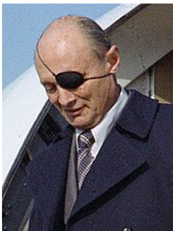
Moše Dajan , jmenovaný novým ministrem obrany jen několik dní před vypuknutím války

Podrobnější informace naleznete v článku Šestidenní válka . I přes prohru v suezské krizi Násirova pozice zůstala silná a proegyptský režim vládl od roku 1958 také v Jordánsku. V Sýrii proběhlo několik převratů, pučisté však neměli příliš silnou podporu obyvatelstva, a tak se ji snažili získávat militantní protiizraelskou rétorikou. Využívali také palestinských uprchlíků , kteří vytvořili roku 1964 Organizaci pro osvobození Palestiny (OOP) , jež začala podnikat nájezdy na izraelské území. Prostředky a zbraně získávaly arabské státy zejména od Sovětského svazu . [63]