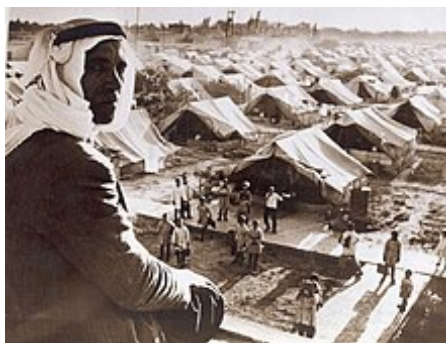
Tábor palestinských uprchlíků

arabských uprchlíků přibližně odpovídá počtu židovských uprchlíků z arabských zemí. OSN nakonec tedy vytvořila úřad pro palestinské uprchlíky (UNRWA), jenž jim měl pomoci začlenit se do společnosti v zemích, do kterých se uchýlili. Arabské vlády však s UNRWA odmítaly spolupracovat, neboť palestinští uprchlíci představovali pro arabské státy vhodný nástroj ideového boje proti Izraeli, takže činnost tohoto úřadu přinesla jen dílčí výsledky. [47]