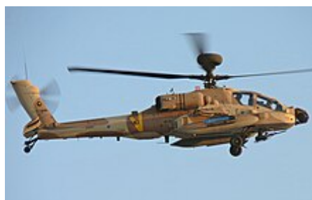
Bitevní vrtulník Hughes AH-64 Apache, kterým izraelská armáda provádí mj. mimosoudní likvidace

Dlouhodobě kulminující napětí [103] mezi Izraelci a Palestinci vyvrcholilo 28. září 2000 , kdy se Ariel Šaron , ze strany Likud , za doprovodu více než tisíce policistů, [103] vypravil na Chrámovou horu . Přestože Šaron uváděl, že návštěva byla „poselstvím míru,“ [106] je patrné, že snahou bylo získat popularitu na izraelské politické scéně před blížícími se parlamentními volbami. [103] Šaronova „návštěva“ Chrámové hory se uvádí jako příčina vypuknutí Druhé intifády neboli Intifády al-Aksá . Je nutné ale uvést, že nepokoje byly dlouhodobého charakteru, a pokud by se Šaron nevypravil na Chrámovou horu, je pravděpodobné, že by si Palestinci našli jinou záminku. [103]