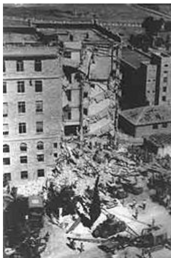
King David Hotel po explozi

však tváří v tvář přicházející druhé světové válce a holocaustu ukázal jako fatální rozhodnutí a pro evropskou židovskou populaci jako rozhodnutí katastrofální. [23] I přes toto omezení do Palestiny přijížděli uprchlíci v rámci ilegální aliji, tzv. Aliji Bet . Ke konci druhé světové války tvořili Židé v Palestině 33 % populace, oproti 11 % v roce 1922 . [29]