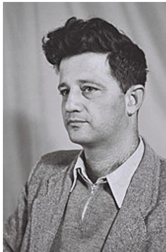
Jizhar Smilansky , jeden z izraelských spisovatelů upozorňujících na postavení izraelských Arabů

Ben Gurion ze strany Mapaj odešel a s ním i všichni jeho přívrženci, kteří založili stranu Rafi . Nová strana si kladla za cíl modernizaci státu, opuštění socialismu a snížení vládních zásahů do ekonomiky. Ve stejném roce proběhly volby, ve kterých zvítězil Mapaj. Během následujících tří let se však „stařešinský“ Mapaj zreformoval a rozpory mezi jednotlivými stranami se zmírnily natolik, že roku 1968 došlo ke sjednocení stran Mapaj , Achdut ha-avoda a Rafi do strany Izraelská strana práce (známá také jako Avoda). Záhy se ke vzniklé straně připojil také Mapam . [55]