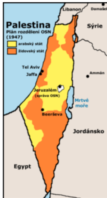
Plán OSN na rozdělení britského mandátu Palestina z r. 1947

reagovali v červnu 1946 důkladnými raziemi a pozatýkáním části představenstva Židovské agentury (tzv. „ černá sobota “). Hagana se poté rozhodla svůj postup zmírnit; Irgun a Lechi naproti tomu svou činnost zintenzivnili a jejich mnohdy teroristické útoky nakonec vyvrcholily útokem na hotel King David . [33]