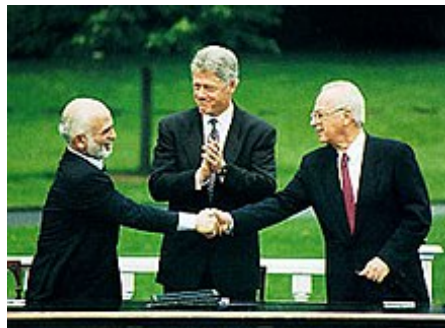
Husajn I. , Bill Clinton a Jicchak Rabin během izraelsko-jordánských mírových jednání

Mírový proces se pokusil narušit židovský osadník Baruch Goldstein , když 25. února 1994 v Hebronské svatyni patriarchů postřílel 29 modlících se muslimů . Palestiňští radikálové využili tento incident jako záminku k rozpoutání násilí. Novým jevem se staly sebevražedné atentáty, na které Izraelci reagovali vojenskými zásahy a úzavěrami palestinských území. [93] Mírový proces však i přes tyto problémy pokračoval. Po několika měsících Rabin a Arafat podepsali Smlouvu o odchodu izraelských jednotek z Gazy a Jericha ( The Agreement on Gaza and Jericho ). Prezidentem Palestinské samosprávy se oficiálně stal Jásir Arafat a 1. července 1994 přesunul své sídlo z Tuniska do Gazy. [94]