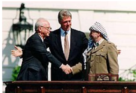
Jicchak Rabin , Bill Clinton a Jásir Arafat po podepsání Mírových dohod z Osla ve Washingtonu 13. září 1993.

Podrobnější informace naleznete v článku Mírová dohoda z Osla .