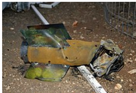
Raketa Kassám vypálená z Pásmu Gazy, která dopadla na město Aškelon v listopadu 2006

Hamas . Takový výsledek nečekala druhá nejsilnější strana – hnutí Fatah , která se s Hamasem nedohodla na společné vládě. Vystal zároveň problém, že státy světa odmítly spolupracovat s teroristickou organizací a rovněž Izrael reagoval tak, že zadržel veškeré celní poplatky na palestinské zboží. To mělo v důsledku za následek, že orgány palestinské autonomie přestaly vyplácet platy svým zaměstnancům, což jednak polarizovalo palestinskou společnost a jednak tím zásadně vzrostla nespokojenost. Posílení pozic Hamasu v Pásmu Gazy jenom vyostřilo napětí mezi Palestinou a Izraelem.