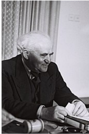
David Ben Gurion

opustili západní Palestinu a utekli do sousedních arabských států byli ubytováni v uprchlických táborech a bylo jim odmítnuto právo na občanství daných států, v nichž se nacházeli.