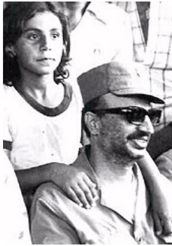
Vůdce OOP Jásir Arafat roku 1974 v palestinském uprchlickém táboře v jižním Libanonu