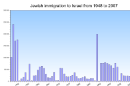
Vývoj počtu židovských imigrantů v letech 1948–2007

pravicový protiarabský revizionistický Cheruť , jenž se snažil neustále zkompromitovat vládu (vyvolal například hysterii proti Rudolfu Kastnerovi , který byl nakonec roku 1957 dokonce zavražděn). Rozpory v izraelské společnosti se projevovaly také ve státní správě , kde přílišná politizace úředníků negativně ovlivňovala spolupráci mezi jednotlivými úřady. Administrativa navíc v počátcích států nedisponovala dostatečnými zkušenostmi, ani vhodným materiálním zázemím. Izraelské demokracii se ukázala jako nepříznivá také snaha náboženských stran přetvořit stát v teokracii , ačkoli velký podíl obyvatelstva byli sekulárními Židy. Snad nejzásadnější vadou izraelské demokracie představoval fakt, že demokratická práva se v celé své šíři přiznávala jen židovské části izraelského obyvatelstva – arabští obyvatelé byli izraelskou armádou z „bezpečnostních důvodů“ vyháněni ze svých domovů a jen zřídka se dovolali spravedlnosti u Nejvyššího soudu. [43]