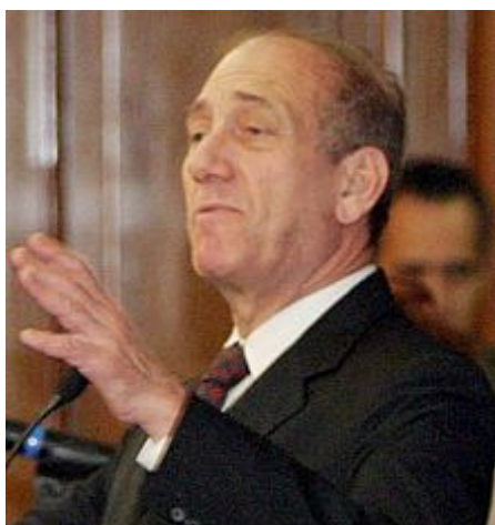
Ehud Olmert v roce 2005

Současně se založením Kadimy Ariel Šaron požádal prezidenta o rozpuštění Knesetu a vypsání předčasných voleb. Ariel Šaron začal stranu Kadima připravovat na předčasné volby, ale po sérii zdravotních problémů utrpěl 4. ledna 2006 vážnou mozkovou mrtvici po níž upadl do kómatu, ze kterého se již neprobral. V lednu 2006 stanul v čele strany tehdejší vicepremiér Ehud Olmert , který se o měsíc později, poté, co byl Ariel Šaron prohlášen za neschopného vykonávat funkci premiéra, ujal funkce premiéra.