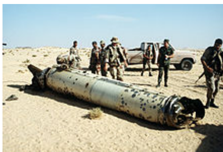
Sestřelená raketa Scud

poskytnuta finanční kompenzace a také protiraketový systém Patriot . Tel Aviv zažil celkem 18 raketových útoků z Iráku, poslední pak 25. února . [85] V následujících měsících došlo ke zhoršení vztahů se Spojenými státy a jako projev dobré vůle po usmíření vyjádřil Bush převážně humanitárními gesty. Byl schválen krátkodobý grant ve výši 650 milionů dolarů, což byly prostředky přislíbené za pasivitu během ostřelování Scudy a pomoc při operaci Šalamoun ( Mivca Šlomo ). Během této operace bylo převezeno takřka celé etiopské židovstvo (14 400 Židů) do Izraele. [86]