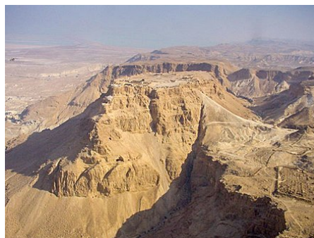
Starověká pevnost Masada

Podrobnější informace naleznete v článku Starověké dějiny Židů .