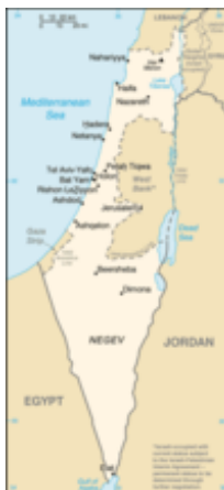
Zelená linie Borderes

Druhý den nato armády pěti arabských států Izrael napadly, a rozpoutaly tak Válku za nezávislost . [14] Po více než roce bojů bylo vyhlášeno příměří a stanoveny dočasné hranice, známé jako Zelená linie . [15] Jordánsko anektovalo území Judeje a Samaří , známé spíše jako Západní břeh Jordánu , a Východní Jeruzalém . Egypt převzal kontrolu nad Pásmem Gazy . Krátce před válkou a během ní došlo k masivnímu arabskému exodu do sousedních arabských zemí, podle odhadů OSN na 711 tisíc Arabů, tj. zhruba 80 % dřívější arabské populace. [16] Arabové, kteří zůstali, byli začleněni do nového státu, zatímco ti, kteří odešli, byli označeni jako uprchlíci bez práva návratu. Arabské země, kde se uprchlíci nacházeli, však nepodnikly žádná opatření vedoucí k jejich začlenění a naopak je udržovali v uprchlických táborech, využívali je jako politický trumf a uměle v nich vyvolávali nenávist vůči Izraeli. [17]