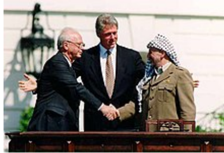
Jicchak Rabin , Bill Clinton a Jásir Arafat po podepsání Mírových dohod z Osla ve Washingtonu 13. září 1993

Podrobnější informace naleznete v článku Mírová dohoda z Osla .