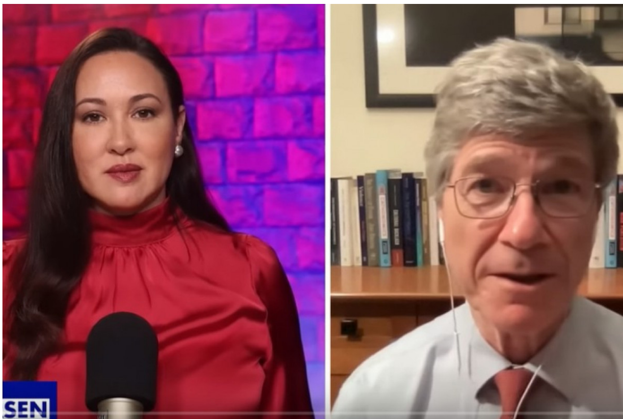
Kim Iversen a Jeffrey Sachs

<< VIDEO >> Do svého pořadu si americká novinářka Kim Iversen pozvala předního amerického ekonoma Jeffrey Sachse, aby se ho zeptala na „ukrajinskou válku“.